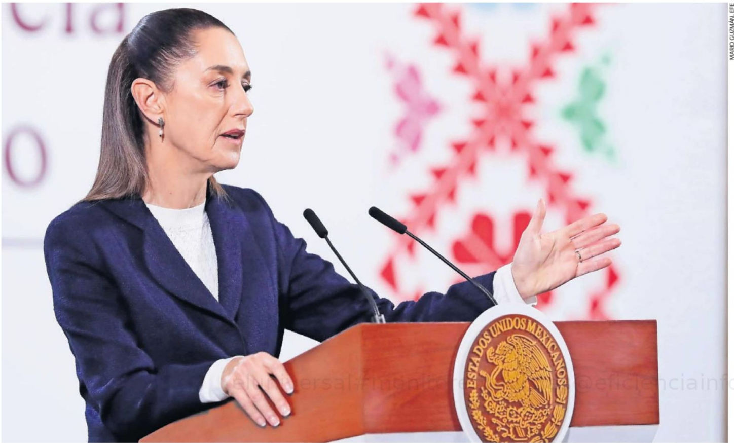
La presidenta Claudia Sheinbaum resaltó algunas iniciativas aprobadas, como la de igualdad sustantiva, la supremacía constitucional y la reforma al Poder Judicial.

“Qué bueno que así como hay diferencias, pues también hay entendimientos y que se haga este frente común frente a la defensa de nuestro país [sobre el acercamiento de la oposición ante amenazas de Trump]”