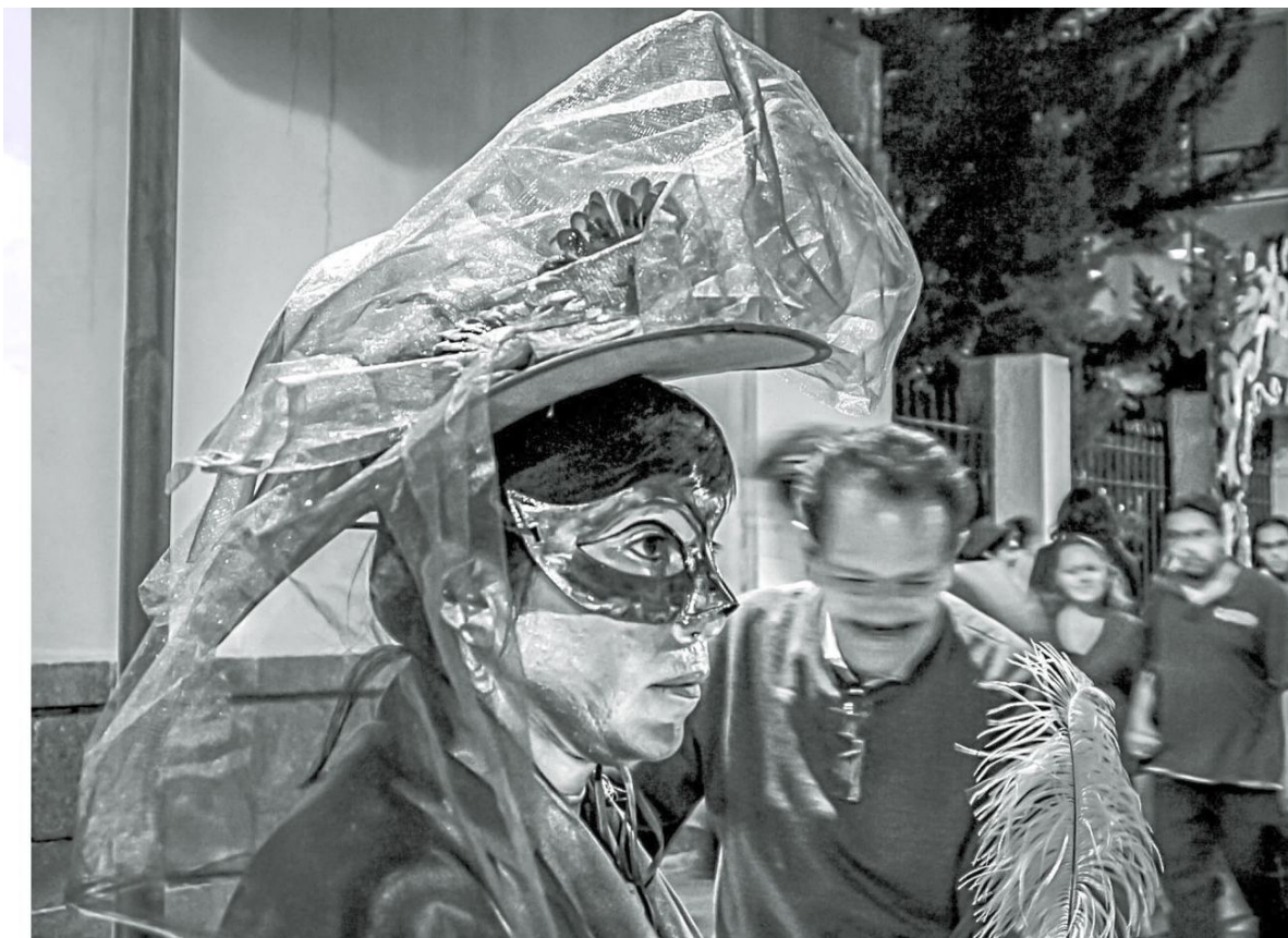
Personaje urbano, CDMX.