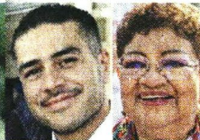
Omar García Harfuch Ernestina Godoy