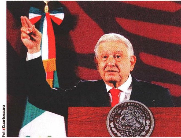
EL PRESIDENTE Andrés Manuel López Obrador, ayer.

“ NO ESTOY metiéndome en nada, además le tengo un gran res- peto a la Presidenta electa, la admiro, es muy inteligente, académicamente es doctora”