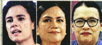
Luisa María Alcalde Ariadna Montiel Rosa Icela Rodríguez