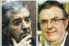
Juan Ramón de la Fuente Marcelo Ebrard