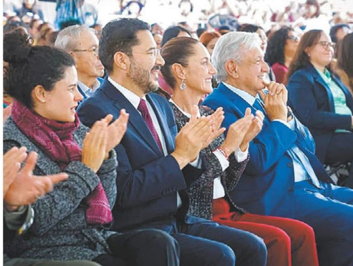
Asistieron el Presidente y su próxima sucesora. ESPECIAL