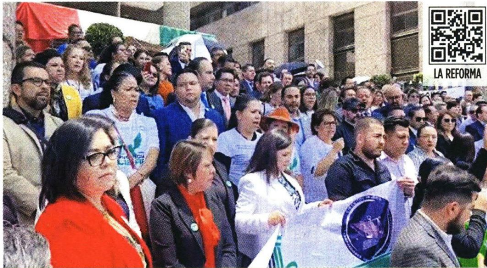
Trabajadores del Poder Judicial protestaron en San Lázaro y anunciaron paro de labores.

Anunció la formación de una coalición para la defensa de la independencia judicial y anticipó la suspensión temporal de labores.