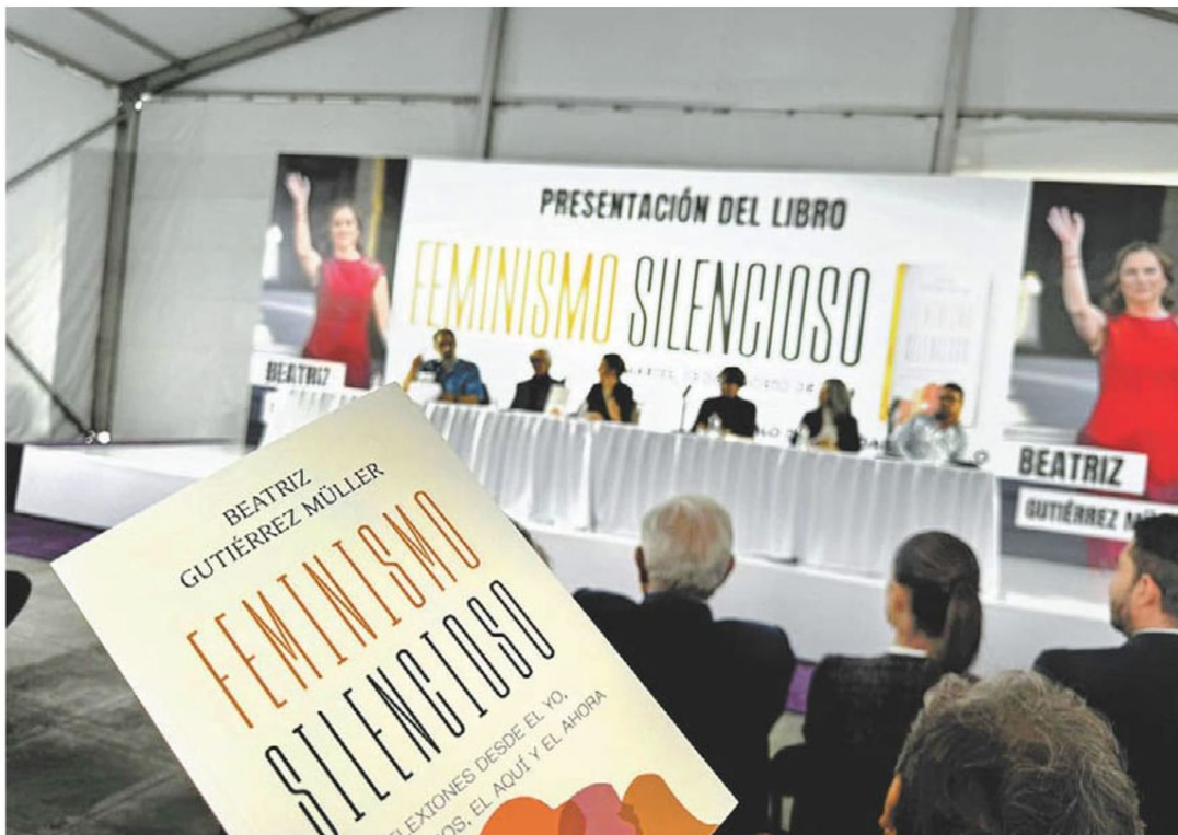
La esposa de López Obrador presentó Feminismo silencioso en el Zócalo.