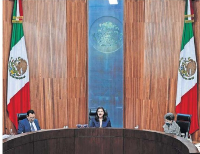
El caso discutido en el TEPJF surgió a raíz de una denuncia contra el PAN por un spot en el que aparece un niño creado con IA.