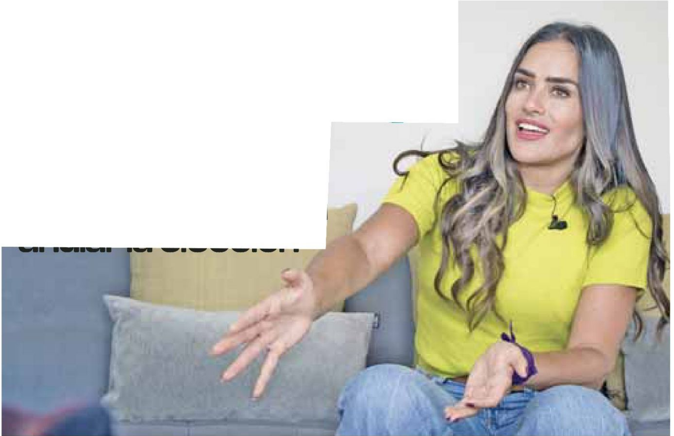
Apoyo. Alessandra Rojo de la Vega destacó que es la mujer más votada en la alcaldía Cuauhtémoc. /NICOLÁS CORTE