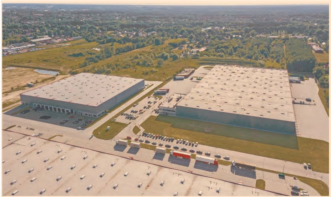
Grandes empresas han puesto la mira en México. Por ejemplo, BMW para construir una nueva planta en San Luis Potosí.