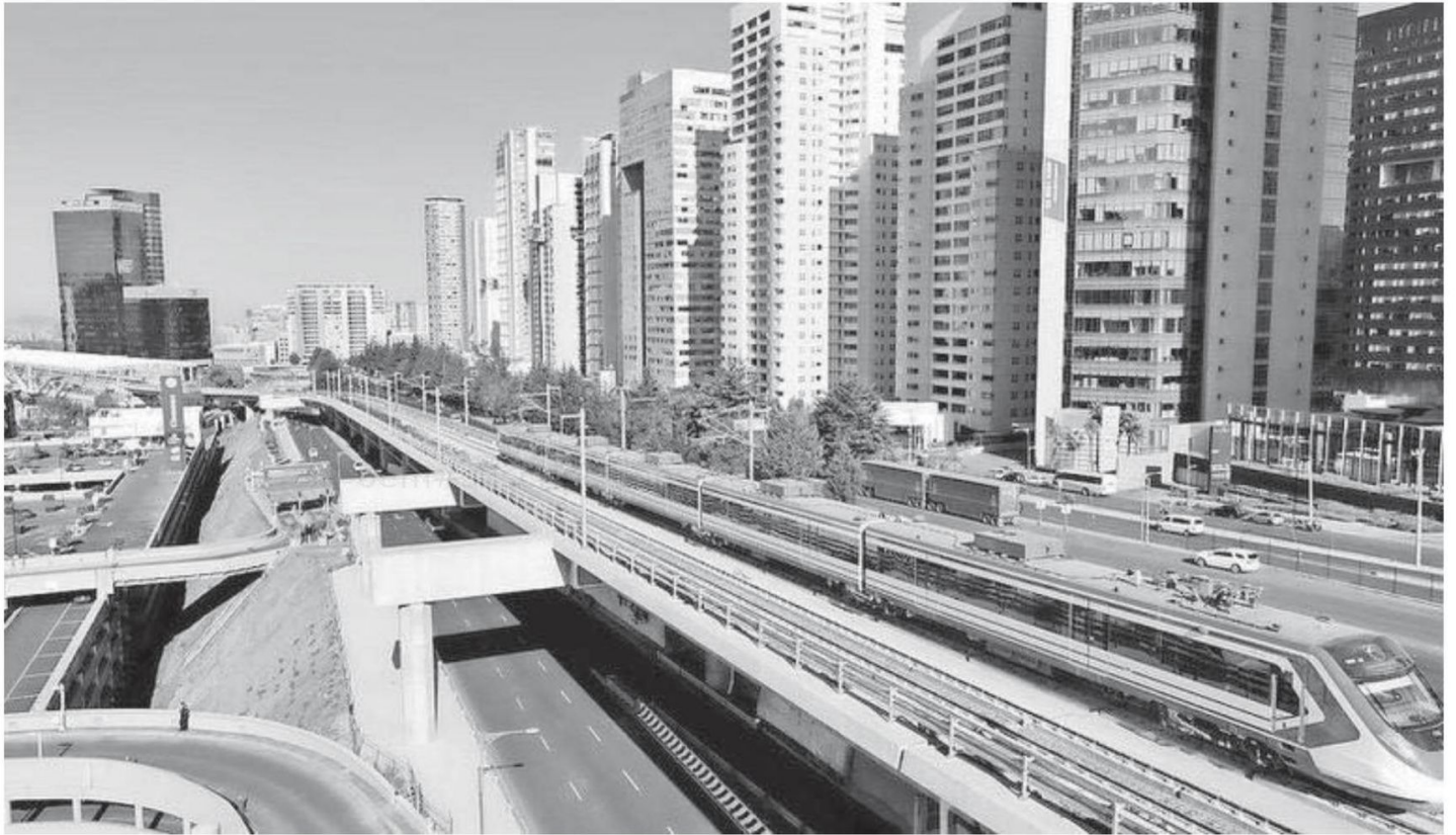
La nueva estación está del lado oriente del Centro Comercial Santa Fe, entre la avenida Vasco de Quiroga y la México-Toluca