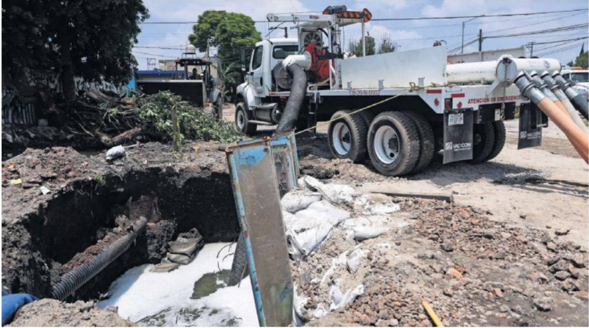
Trabajadores excavan hoyos para verter el agua que desalojan y luego lo bombean a otra infraestructura.