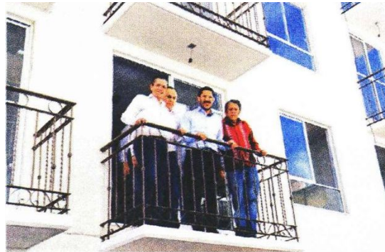
EL JEFE de Gobierno, Martí Batres, durante la entrega de una unidad habitacional en Coyoacán, en 2023.

Mil 168 unidades habitacionales serán beneficiadas