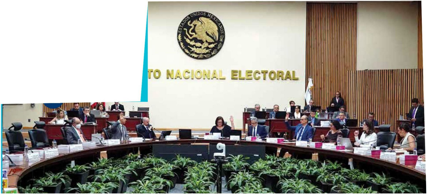
COMICIOS. El Consejo General del INE es responsable de organizar el proceso electoral del 1 de junio de 2025, donde se elegirán a jueces, ministros y magistrados.