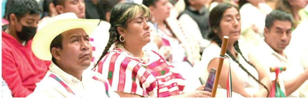
• Otras más buscan obtener este estatus en la capital