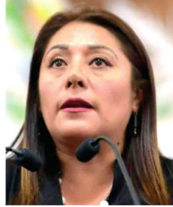
· Busca fortalecerla