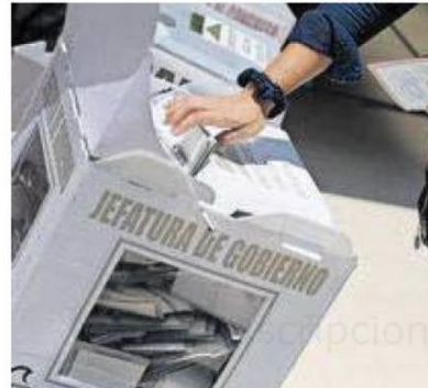
El pasado 2 de junio se eligieron 204 concejalías.