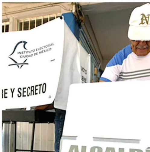
En 27% de las 16 alcaldías

36 fueron electas por mayoría relativa y 20 por representación proporcional