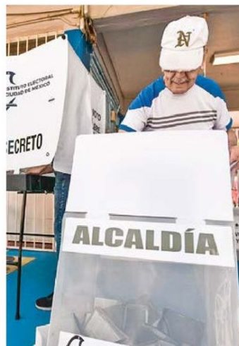
CARGO. De 204 concejalías, 56 se integrarán por jóvenes, adultos mayores y comunidades indígenas.

Habrán 9 cargos de Concejalías para personas de la diversidad sexual, 9 de pueblos y barrios originarios o comunidades indígenas, y 6 de personas adultas mayores, abundó. /24HORAS