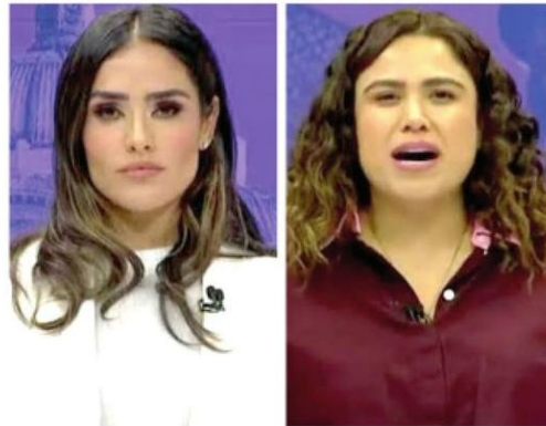
Fue llamada “falsa feminista” por la morenista

· Presiona a la FGJ capitalina para usar a colectivos feministas en mi contra, reveló la próxima titular de la Alcaldía Cuauhtémoc