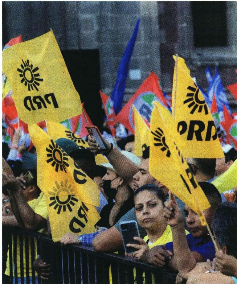
Tras la salida de AMLO del PRD, inició el declive.