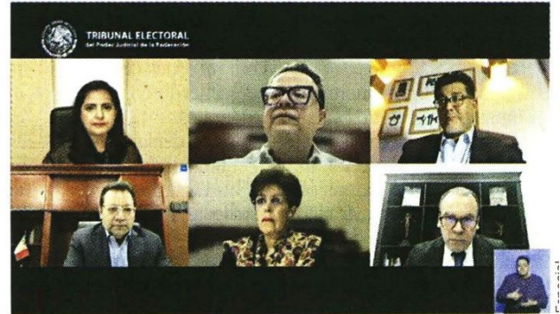
Los magistrados del Tribunal Electoral sesionaron ayer en línea y, por mayoría, dieron luz verde a la elección de jueces.

“Esa determinación es equivalente a validar o invalidar los efectos de resoluciones dictadas por sus juzgados de distrito. Involucrar al pleno en ese proceso es particularmente grave, porque implica no atender la división competencial dentro del sistema legal mexicano”.