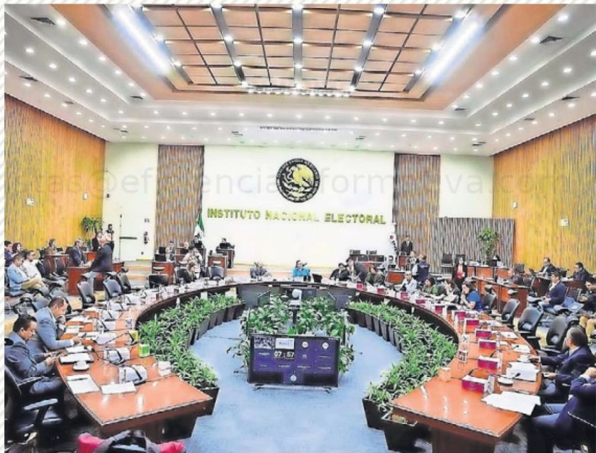
El Instituto Nacional Electoral deberá trabajar a contrarreloj para poder llevar a cabo la elección de jueces y ministros, tal como lo definió la reforma al Poder Judicial.