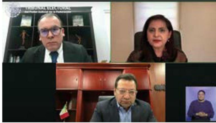
Decisión. Sesión pública virtual del Tribunal Electoral federal.