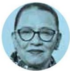
ROSA ICELA RODRÍGUEZ

En alto puso el nombre de México la presidenta Claudia Sheinbaum durante su participación en el G20. Además de promover el programa de Sembrando Vida, sostuvo una decena de reuniones bilaterales con mandatarios y jefes de estado como Joe Biden , de EU; Justin Trudeau , de Canadá; Luiz Inácio Lula , anfitrión y presidente de Brasil; así como con el chileno Gabriel Boric , quien puso de ejemplo a Sheinbaum tras su aportación en la Cumbre y los programas sociales que impulsa.