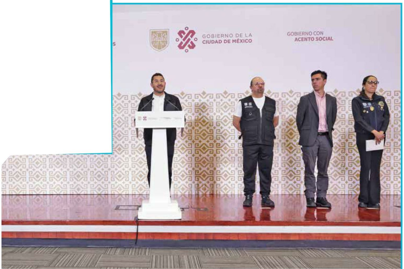
• CIERRE. El mandatario capitalino presentó los proyectos para los próximos días, entre ellos operativos y labor administrativa.