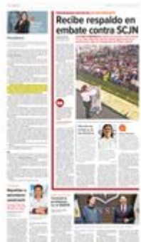
La Presidenta durante su discurso en Jantetelco, donde resaltó los programas sociales.