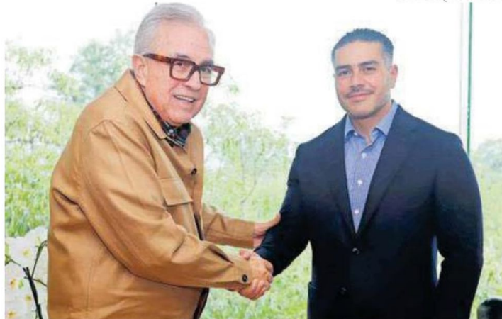
El gobernador Rubén Rocha Moya y Omar García Harfuch