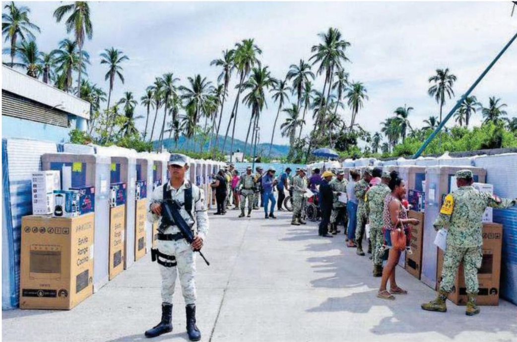
Ejército y Guardia Nacional entregaron enseres a afectados por Otis en Acapulco, en diciembre de 2023

Para la temporada de este año, Conagua previó hasta 41 ciclones: entre 15 y 18 en el Pacífico, y entre 20 y 23 en el Atlántico