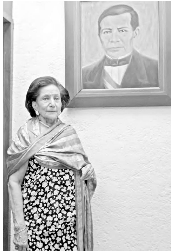
► Su último acto público fue durante la ceremonia de transmisión de poderes el martes pasado; en ese momento se le oyó decir: “Híjole, apenas me sostengo”.