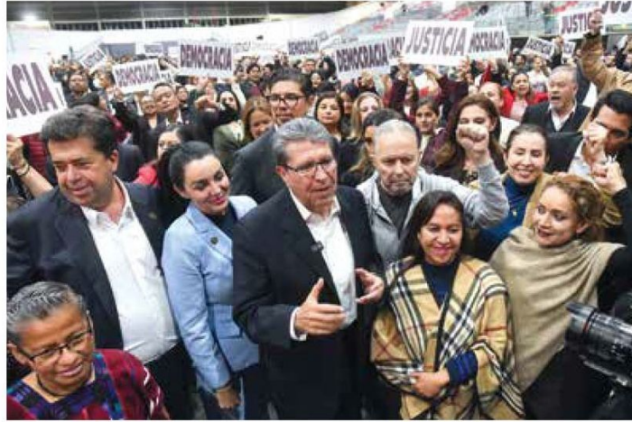
Celebra. Ricardo Monreal, líder de Morena en San Lázaro, ayer.