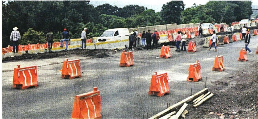
■ Bloqueos en lapsos de dos horas, con paso durante 15 minutos, afectaron a automovilistas.

El tema de estas protestas llegó al Congreso de Morelos, donde se aprobó un exhorto a la SICT para que se atienda a los manifestantes y concluyan las obras prometidas.