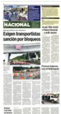
■ Pobladores de Tepoztlán realizaron durante dos días cierres para reclamar afectaciones por la autopista La Pera-Cuautla.