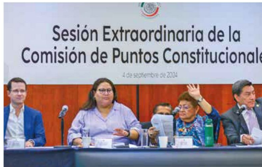
En la Cámara Alta. Comisiones ya recibieron la minuta; el domingo, debatirán.

cios. Con 357 votos y sin aumentar requisitos para elección de juzgadores pasó la reforma en San Lázaro. Estudiantes, trabajadores, juristas, diplomáticos y ONGs piden al Senado escuchar. —E. Ortega / V. Chávez / P. Hiriart.