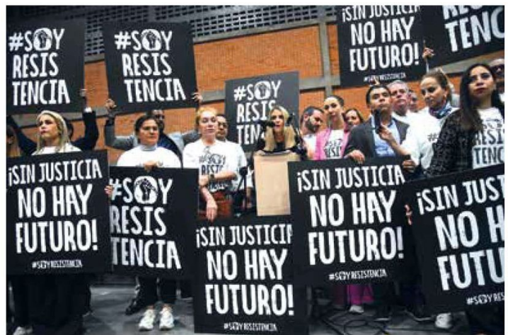
En contra. Diputados del PAN se manifiestan en contra de la reforma judicial.