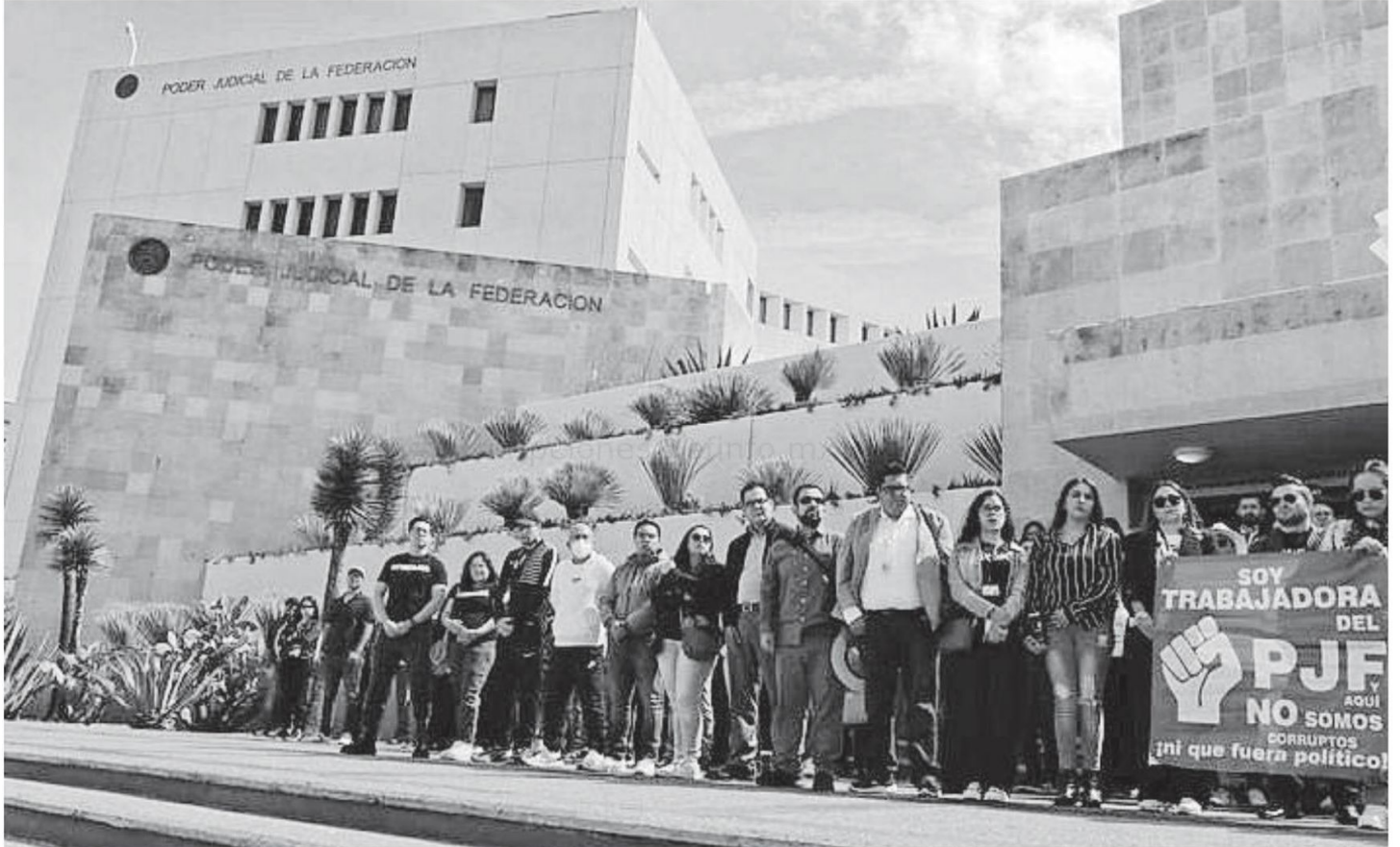
Los trabajadores del PJJF siguen manifestándose en las oficinas de la ciudad de Zacatecas