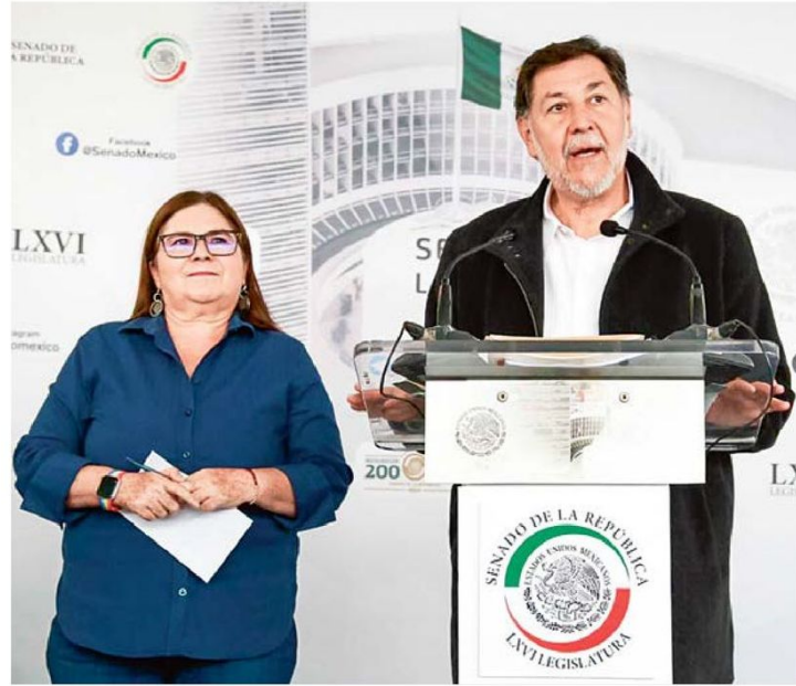
DISCUSIÓN. El presidente de la mesa directiva del Senado, anunció que recibió la minuta con proyecto de decreto de la reforma al Poder Judicial.