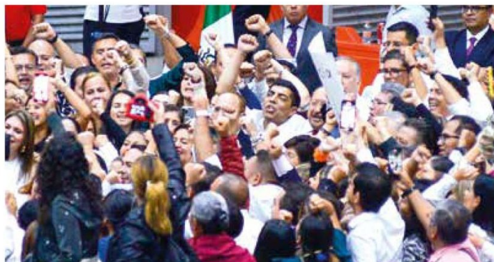
Choque. Intensa resultó la discusión sobre la reforma en la Sala de Armas.