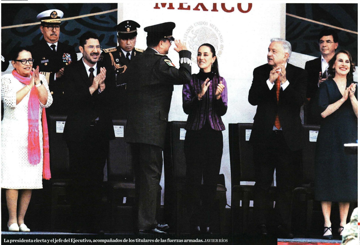
La presidenta electa y el jefe del Ejecutivo, acompañados de los titulares de las fuerzas armadas. JAVIER RÍOS