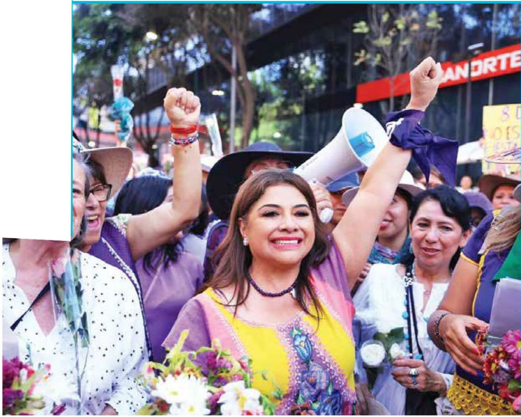
APOYO | Desde su campaña por la Jefatura de Gobierno, Clara Brugada vio por las causas de las mujeres.