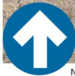
NUEVA ERA. Hoy comienza el ascenso de Claudia Sheinbaum Pardo.