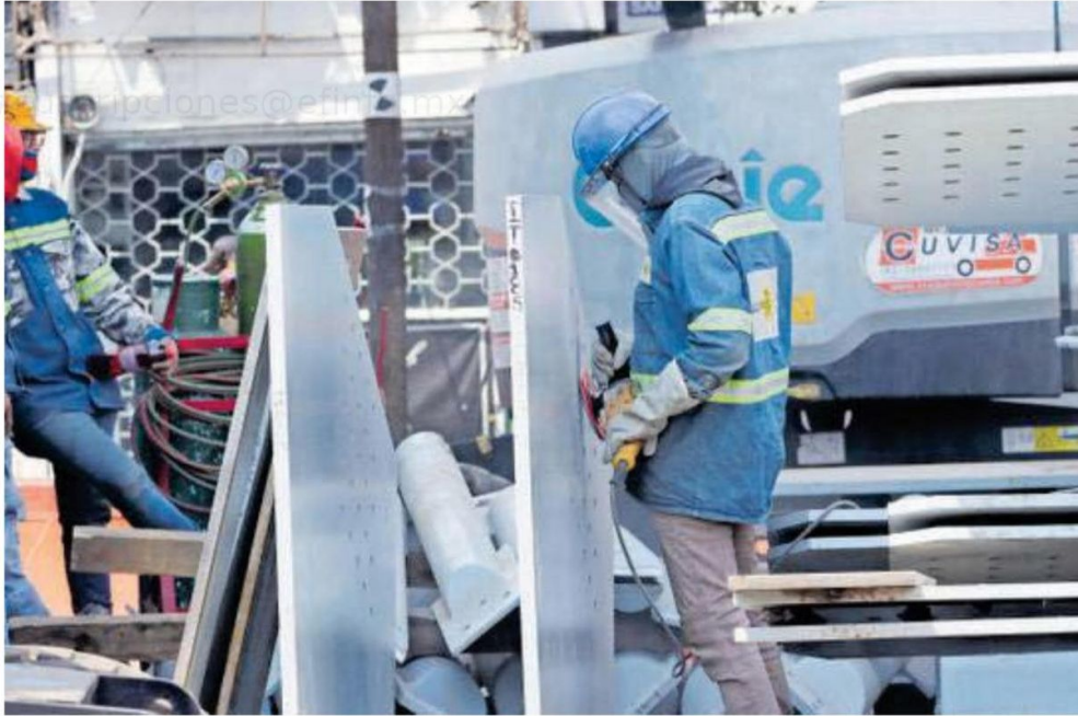
La Cdmx se ubica en el lugar 15 de 66 ciudades por sus condiciones del mercado laboral