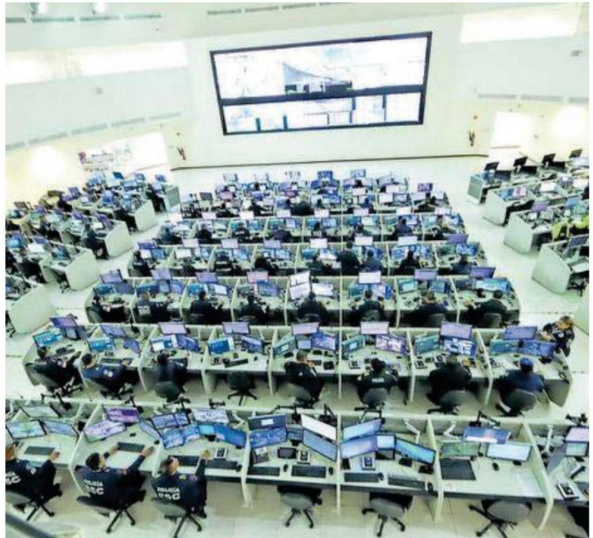
La actual administración modernizó y amplió este centro de vigilancia

SHEINBAUM inició su gobierno con 15 mil cámaras en funcionamiento y casi la mitad eran obsoletas