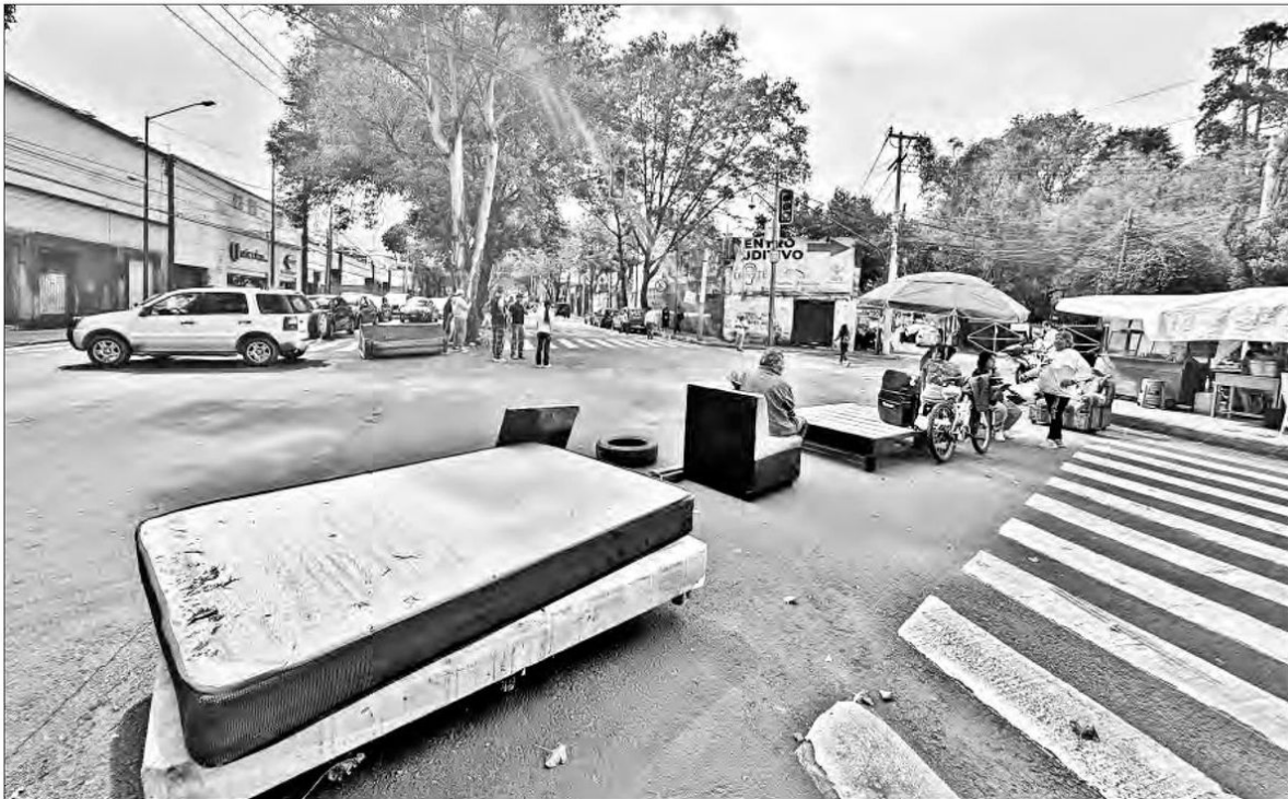
► Más de 50 casas resultaron con daños materiales en la alcaldía Tlalpan. Afectados cerraron la calle en demanda de apoyo.