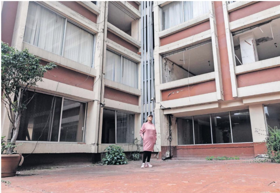
Son 70 familias las que no han podido regresar a sus departamentos en el edificio de Aguascalientes 12, en la colonia Roma Sur, desde hace siete años.