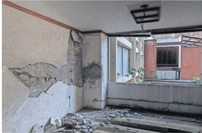
El inmueble que se dañó en el 19-S resiente el paso del tiempo y cada día está más deteriorado y representa mayor riesgo.