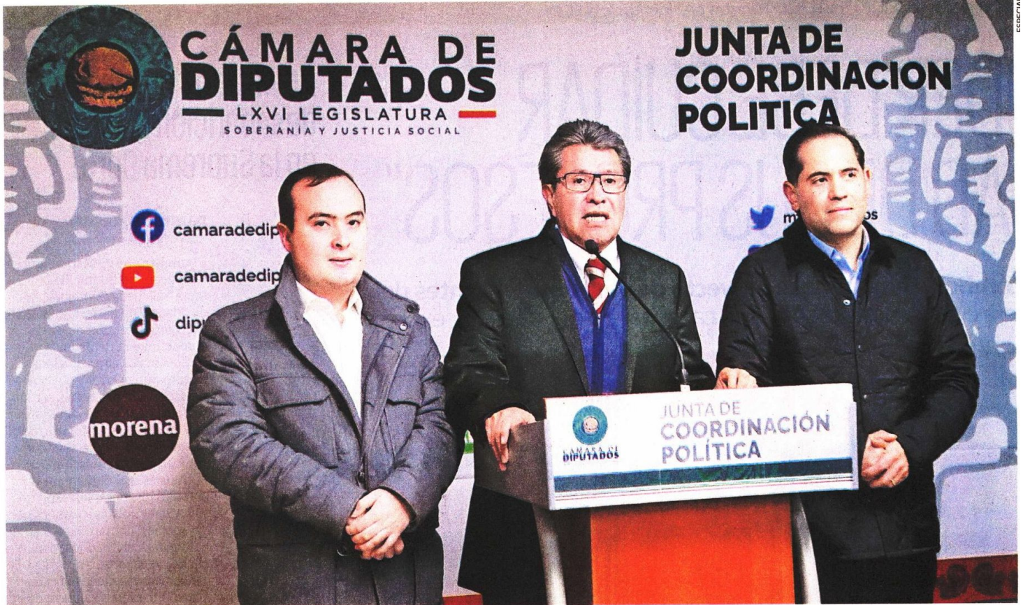
El líder de los diputados morenistas, Ricardo Monreal, dijo que ya tienen listos los ajustes al Presupuesto de Egresos de la Federación para 2025, que serán votados hoy.

de los fideicomisos del Poder Judicial serán usados por el gobierno.