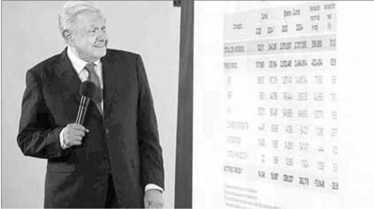
▲ López Obrador señaló en su conferencia matutina la importancia de dejar finanzas públicas sanas a Claudia Sheinbaum.