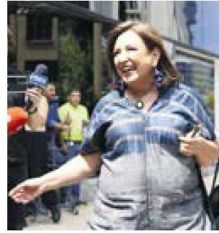
Regreso. Xóchitl Gálvez, excandidata a la Presidencia, ayer, en el Senado.