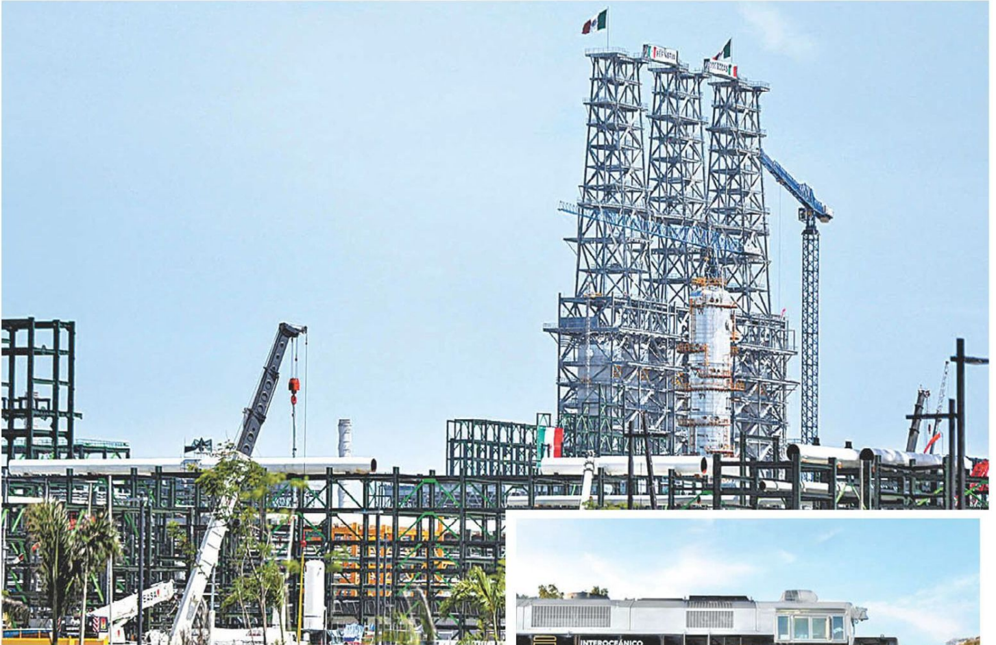
Si bien fue inaugurada en 2022 sin producir gasolinas, actualmente ya procesa 65 mil barriles por día. ESPECIAL