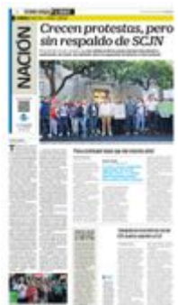
Trabajadores del Poder Judicial realizaron el cierre simbólico del edificio del Máximo Tribunal del país por más de siete horas, como protesta contra la reforma en la materia.