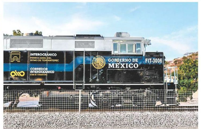
El proyecto ferroviario en el sureste. ESPECIAL