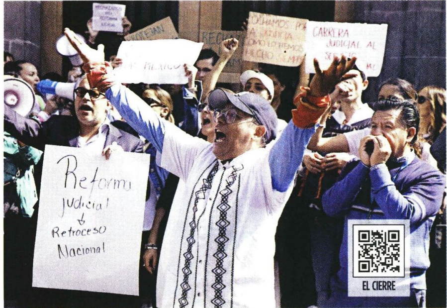
OBJECCIÓN. Empleados de la Suprema Corte bloquearon todos los accesos a la sede central en protesta por la reforma judicial.

Si los inconformes radicalizan su postura e impiden el paso totalmente, la Corte tendría que sesionar por video conferencia, como hizo durante la pandemia por Covid-19.