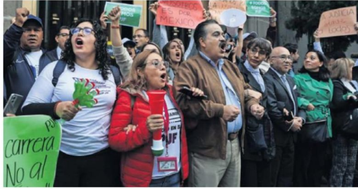
Grupos de trabajadores de la Corte y del Consejo de la Judicatura Federal se manifestaron ayer; sus protestas se intensifican cada vez más.