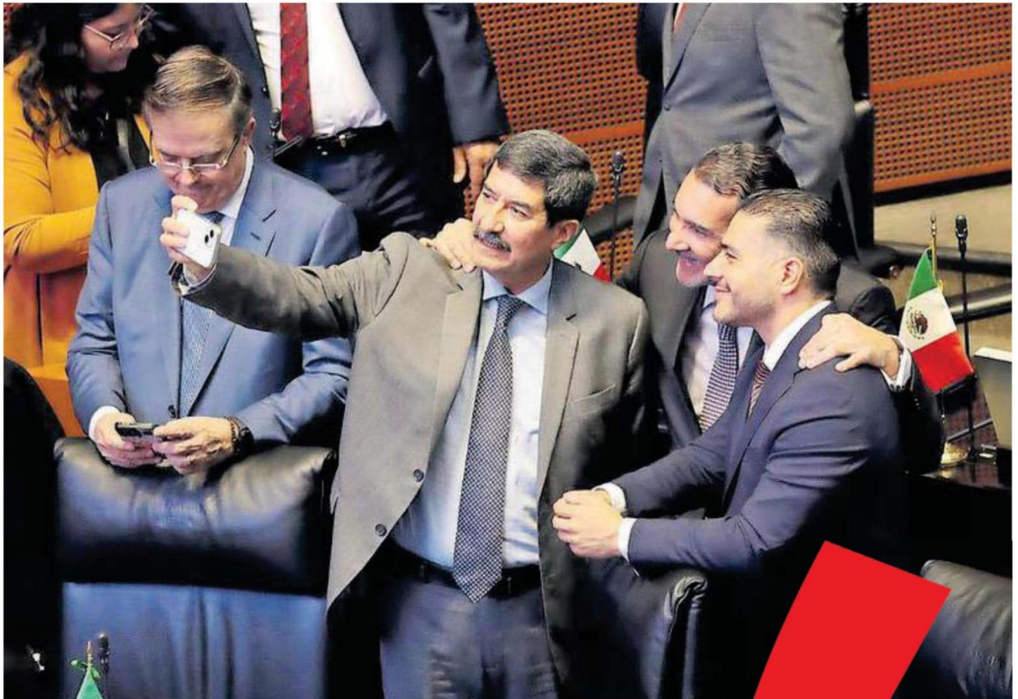
Javier Corral se tomó una selfie con los nuevos senadores, entre ellos Omar García Harfuch