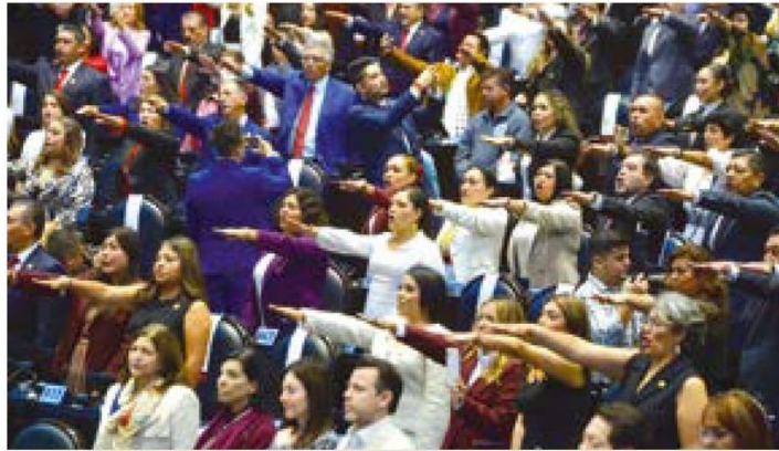
LEGISLATURA. Los diputados, ayer, al rendir protesta.