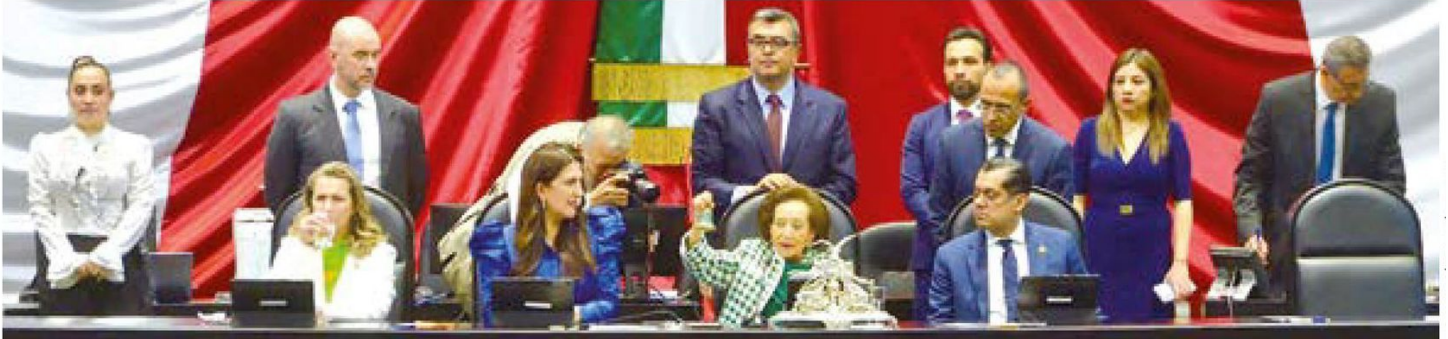
INICIO. Ifigenia Martínez, al asumir la presidencia de la Cámara de Diputados, ayer.

reforma al Poder Judicial, y sesionaremos después el lunes, martes, miércoles, y quizás hasta el jueves, para discutir y votar la reforma al Poder Judicial” impulsada por López Obrador.