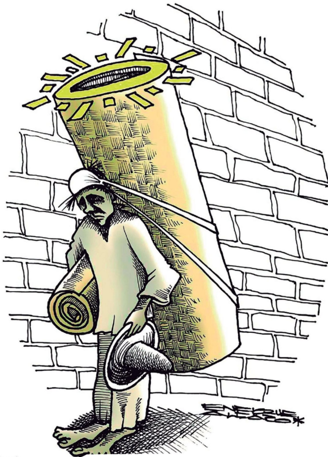
Ilustración: Enrique Alfaro.