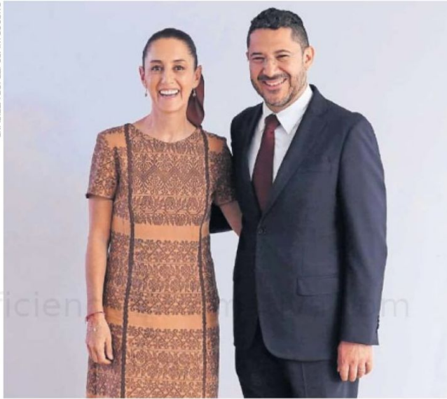
La presidenta electa, Claudia Sheinbaum, presentó en conferencia a Martí Batres como el próximo director general del ISSSTE.