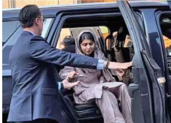
• ARRIBO. Malala a su llegada a Palacio Nacional.