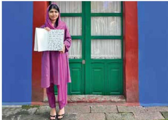
• VISITA. La Premio Nobel estuvo en la Casa Azul.