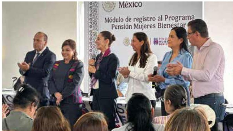
• SUPERVISIÓN. La Presidenta, en la alcaldía Venustiano Carranza.