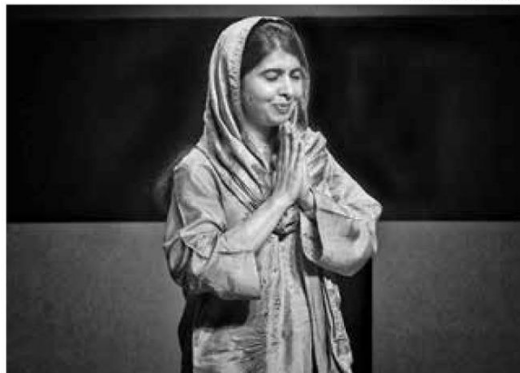
• APORTA. También participó en diversos foros.