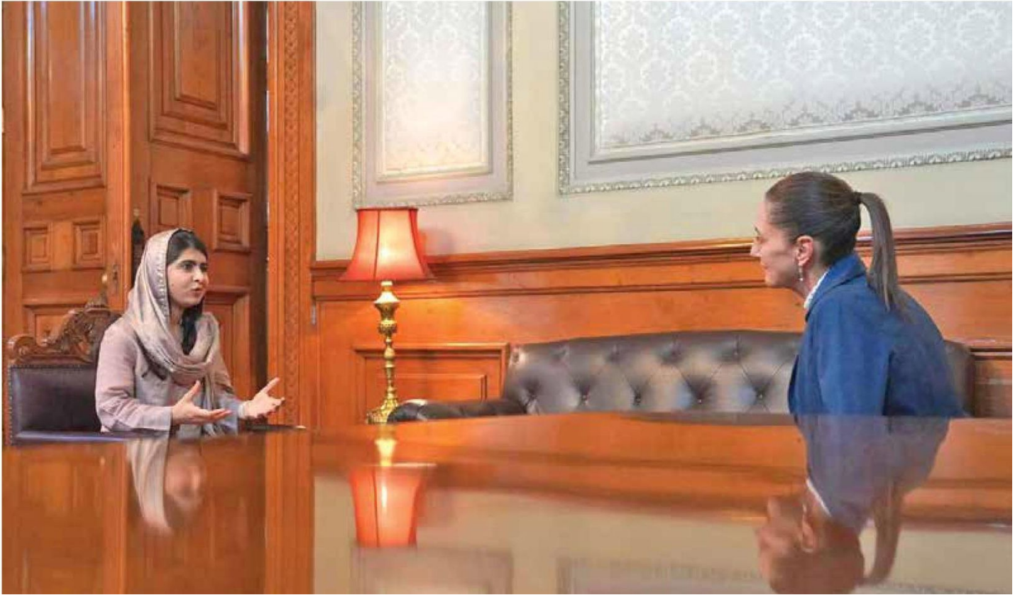
DIÁLOGO. La presidenta de México dio a conocer en sus redes sociales la reunión que tuvo con la activista pakistaní.