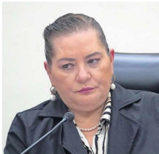
Hace unos días la consejera presidenta del INE, Guadalupe Taddei, dio a conocer el presupuesto necesario para la elección.

se contemplaba en un inicio para la elección de jueces, magistrados y ministros de la SCJN.