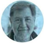
GERARDO FERNÁNDEZ NOROÑA