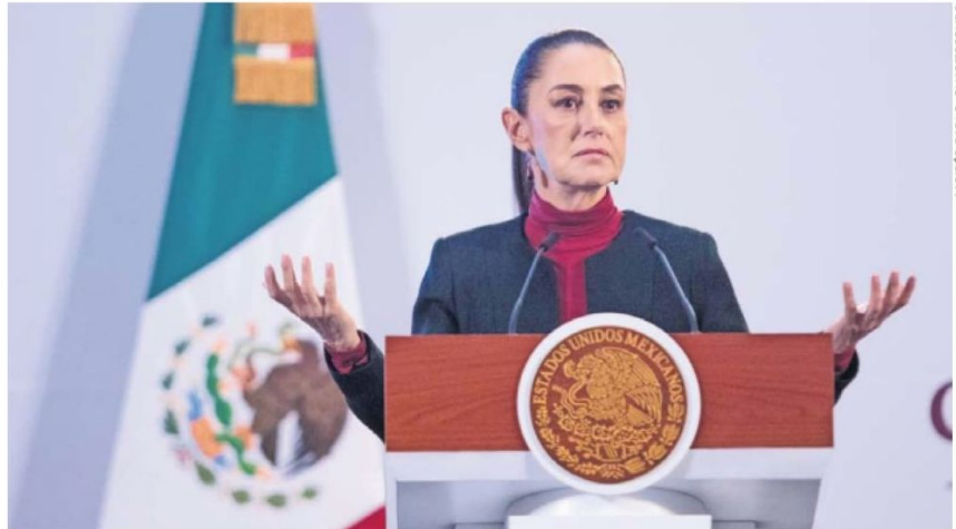
La presidenta Claudia Sheinbaum aseguró que habrá elecciones de jueces y magistrados.

"No se puede negociar lo que ya ha decidido el pueblo y lo que ya es parte de la Constitución. Ya es parte de la Constitución la reforma al Poder Judicial"