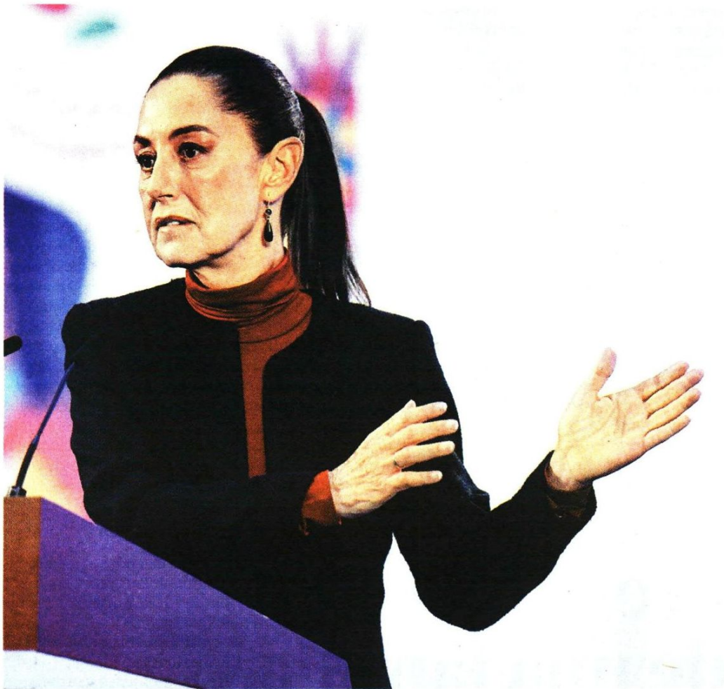
La mandataria en la conferencia mañanera.