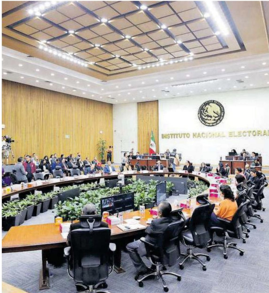
Consejeros del Instituto Nacional Electoral en sesión durante el mes de julio