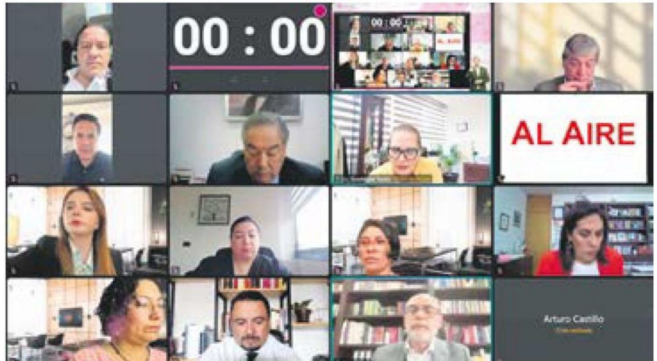
Votación. Consejeros electorales, durante la aprobación del presupuesto.

“No entendemos cómo es que habían dicho que máximo eran 7