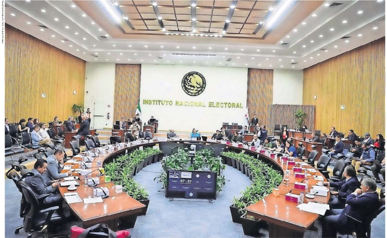
El Consejo General del INE aprobó por unanimidad el presupuesto precautorio para la realización de la elección judicial.