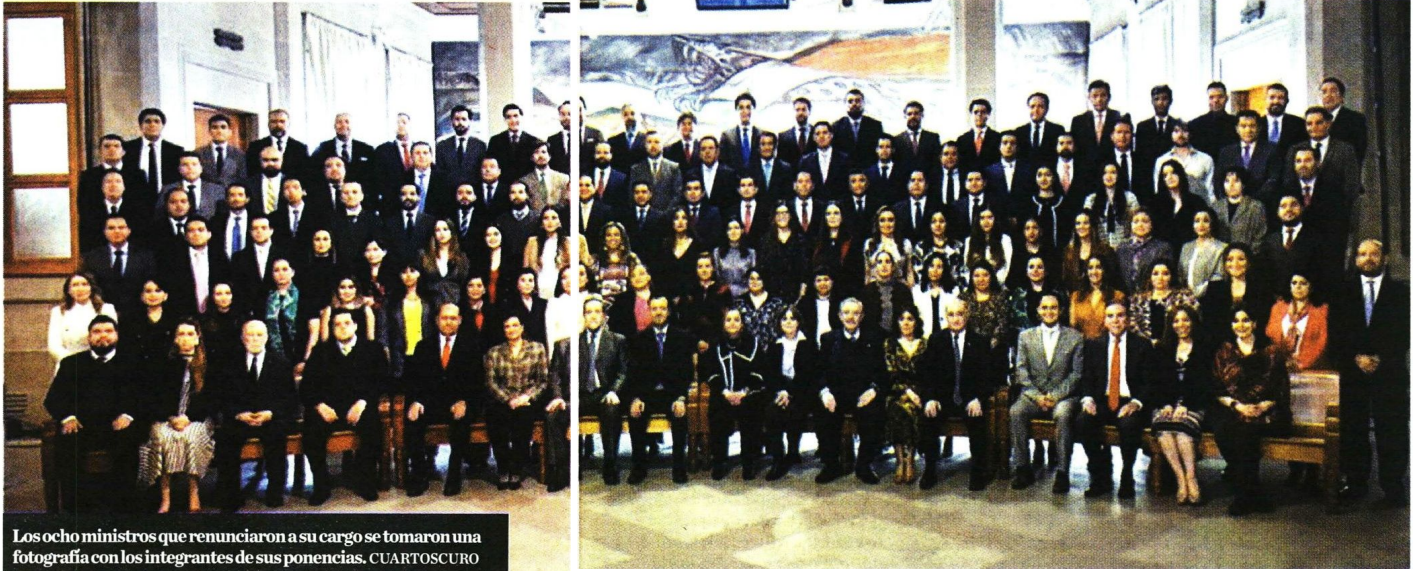
Los ocho ministros que renunciaron a su cargo se tomaron una fotografía con los integrantes de sus ponencias.