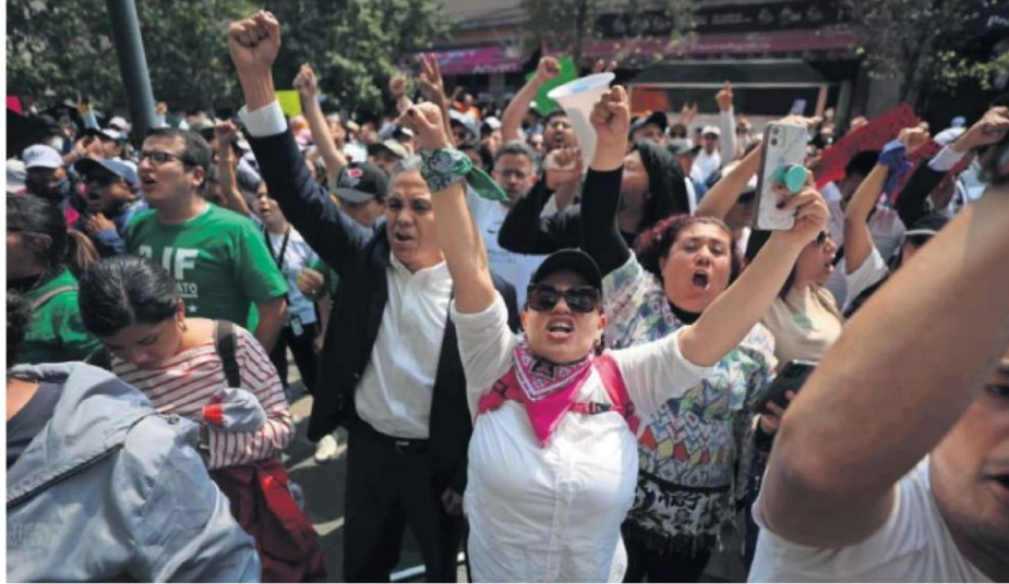
Trabajadores del Poder Judicial continuaron con manifestaciones ante la falta de entendimiento a las suspensiones al INE.