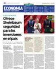
GOBIERNO. La Presidenta de México, Claudia Sheinbaum, durante su toma de protesta en la Cámara de Diputados.