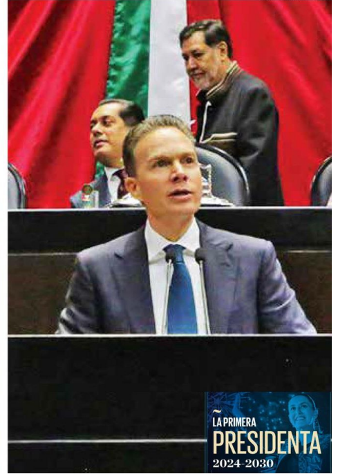
VOCES. Los legisladores se congratularon de la llegada a la Presidencia de la primera mujer y brindaron su apoyo al proyecto, con un llamado al diálogo.