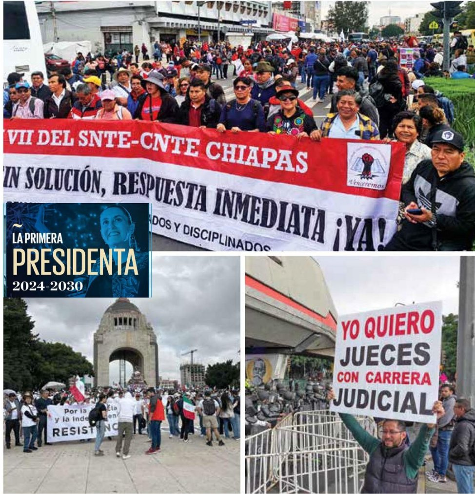
• MANIFESTACIONES. Por la mañana, protestaron trabajadores del PJ y maestros de la CNTE.