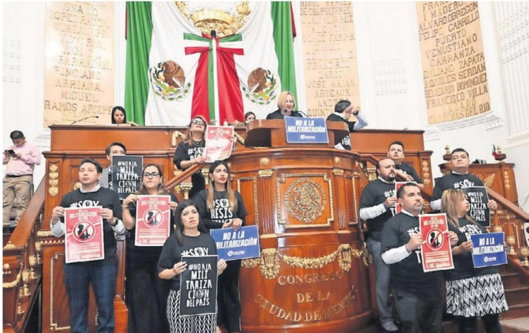
En el debate en el Congreso capitalino, los diputados panistas llevaron playeras negras con la leyenda "Soy la resistencia" y en cada una de sus intervenciones mostraron carteles que decían "No a la militarización".