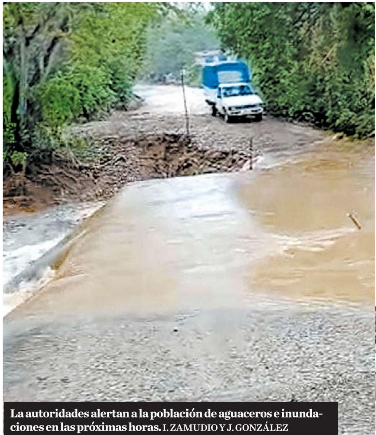
La autoridades alertan a la población de aguaceros e inundaciones en las próximas horas. I. ZAMUDIO Y J. GONZÁLEZ