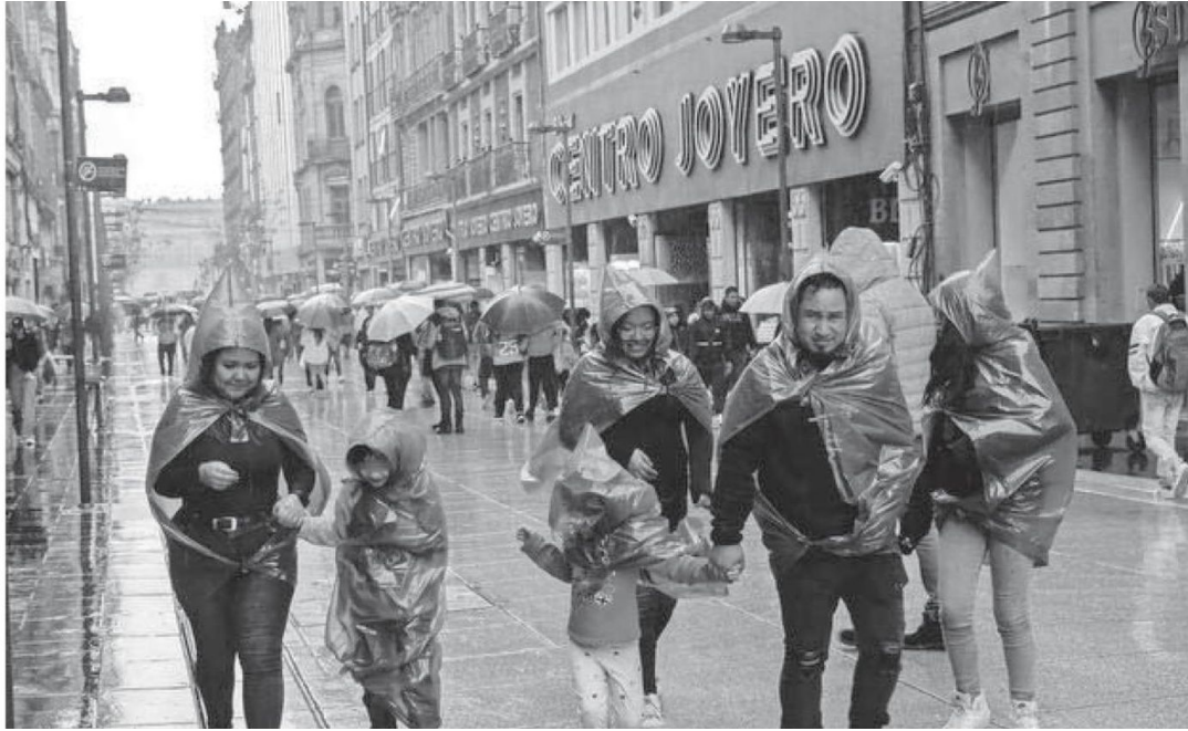
La Ciudad de México es afectada por los efectos de la depresión tropical tres