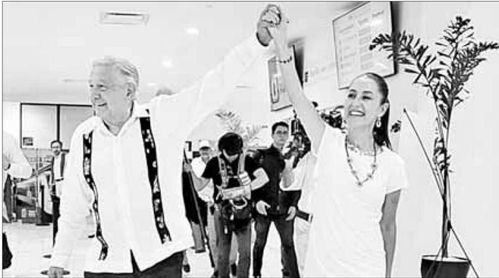
▲ Imagen que compartió el presidente Andrés Manuel López Obrador en sus redes sociales luego de supervisar los avances de las obras del Tren Maya. Los trabajos deberán estar terminados en septiembre.