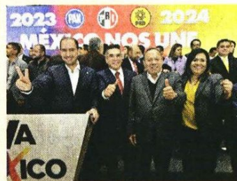
Los presidentes del PRI, PAN y PRD, Alejandro Moreno, Marko Cortés y Jesús Zambrano, firman el acuerdo de la coalición "Va X México" para la candidatura de 2024.

Renuncian al partido figuras como Miguel Ángel Osorio Chong, Claudia Ruiz Massieu, Eruviel Ávila, entre otros.