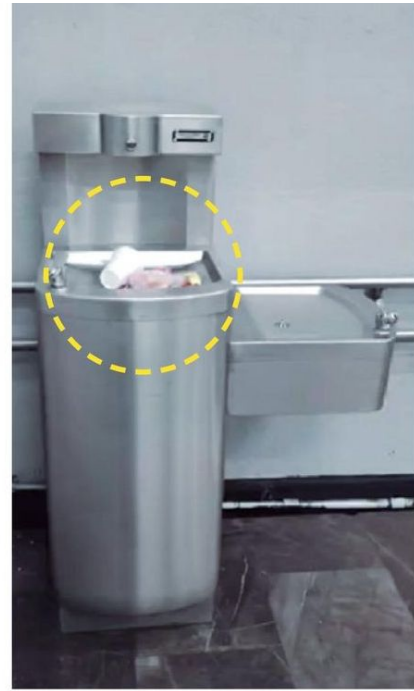
Muchos bebederos se han convertido en receptores de basura.