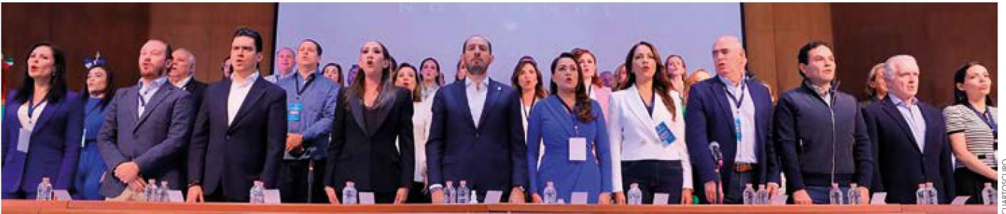
Cónclave. El fin de semana, el PAN realizó su sesión extraordinaria de Consejo General.