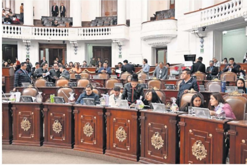
Los diputados de la III Legislatura tendrán 15 mil pesos más para destinarlos a sus módulos.