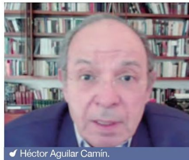
Héctor Aguilar Camín.

El Universal y su director, Juan Francisco Ealy Ortiz; Televisa; Grupo Fórmula; Ciro Gómez Leyva; Carmen Aristegui; Denise Dresser; Héctor Aguilar Camín; Joaquín