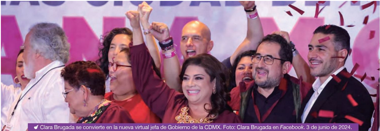
Clara Brugada se convierte en la nueva virtual jefa de Gobierno de la CDMX.