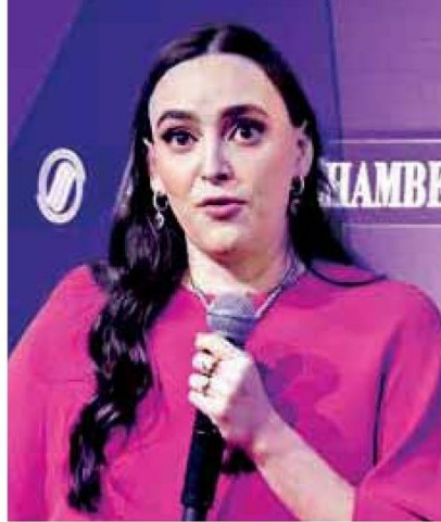
Gómez | Fortalecer el mercado interno.