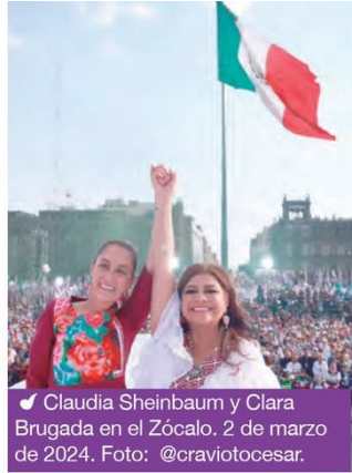
✓ Claudia Sheinbaum y Clara Brugada en el Zócalo. 2 de marzo de 2024.

Las "Utopías" son ejemplo de recuperación del espacio público, un modelo reconocido por la