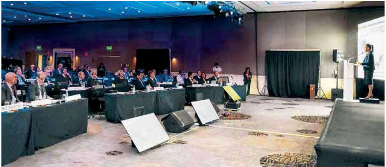
Crear el Consejo Nacional de Desarrollo y Relocalización.

de Desarrollo Profesional y Técnico, así como un Plan Nacional de Infraestructura que incluye la construcción de carreteras, aeropuertos y nuevos kilómetros de trenes de pasajeros, además de la creación de la Agencia de Transformación Digital y Telecomunicaciones.