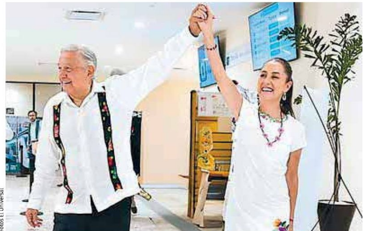
López Obrador y Sheinbaum | Transformación profunda.

Dado que las reformas enviadas por el Ejecutivo federal se discutirán en comisiones previo al 1 de septiembre, el 2 de agosto