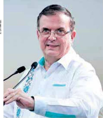
Ebrard | Portafolio de inversión 2025.

enorme para nuestro país, que a todos los mexicanos va a beneficiar”, aseguró al presentar su proyecto de nación, así como su visión de “prosperidad compartida” en beneficio de todo el pueblo de México.