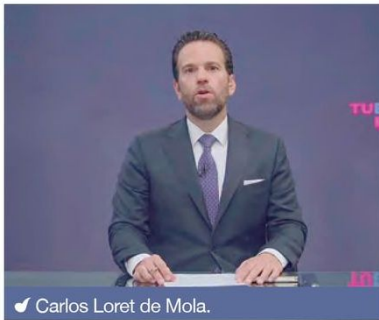
✓ Carlos Loret de Mola.

En los primeros análisis de esta consultora –retomados por la mayoría de los medios opositores–, se aseguró