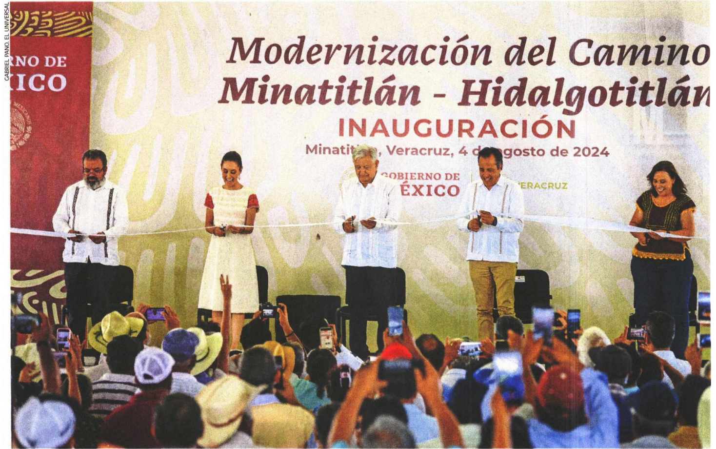
Claudia Sheinbaum, virtual presidenta electa de México, acompañó al presidente López Obrador en la ceremonia de inauguración de la carretera Acayucan-La Ventosa.