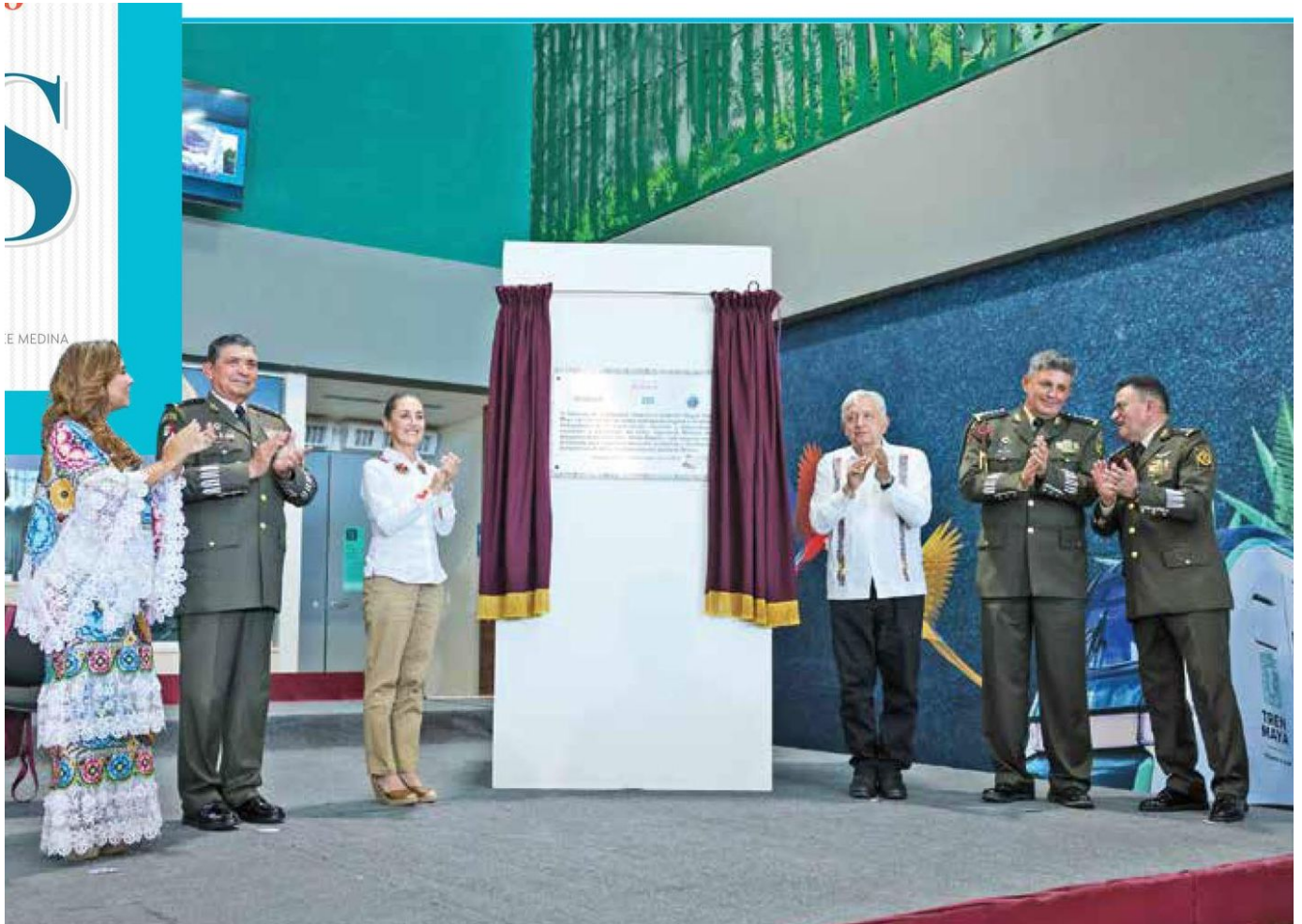
CIRCUITO. El presidente López Obrador inauguró la estación Chetumal, con la que se completa el recorrido del Tren Maya.