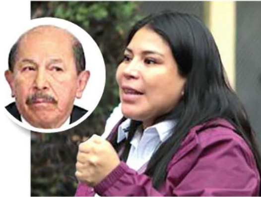
· Criticó a quien será su antecesor en Iztacalco

· La demarcación detectó 14 árboles en riesgo en 2022 y 17 un año después