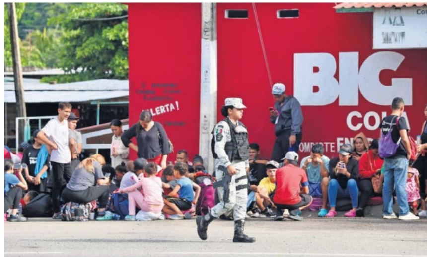
La Guardia Nacional ha triplicado su presencia en la frontera sur de México. El objetivo militar es incrementar el control migratorio.