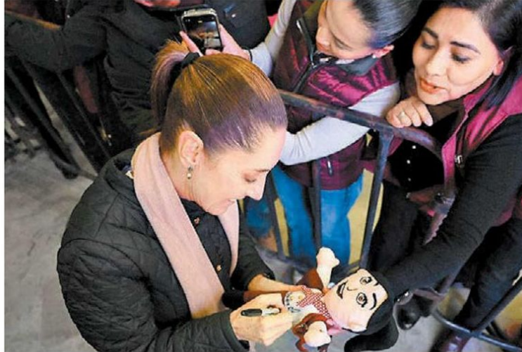
La Presidenta en el Polyforum La Fe de Nuevo Laredo.