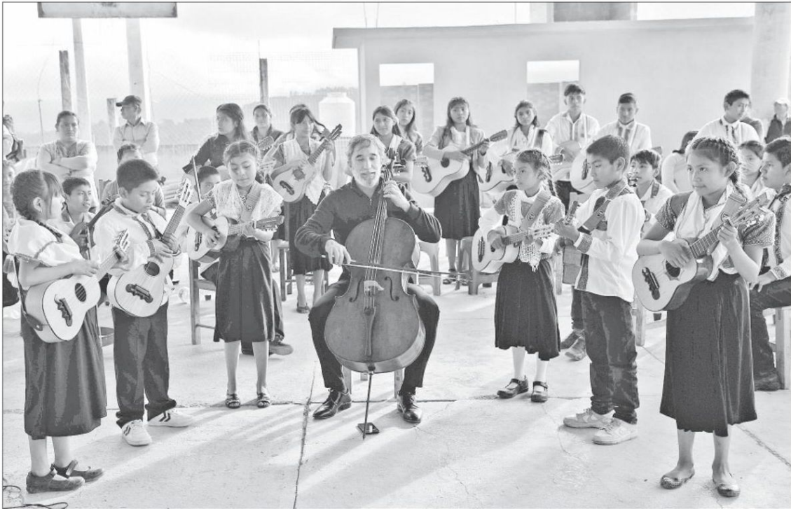
▲ Concierto en Matatlaca, Puebla, donde tres maestros enseñaron a tocar a un grupo de niños que ahora son maestros de más menores.