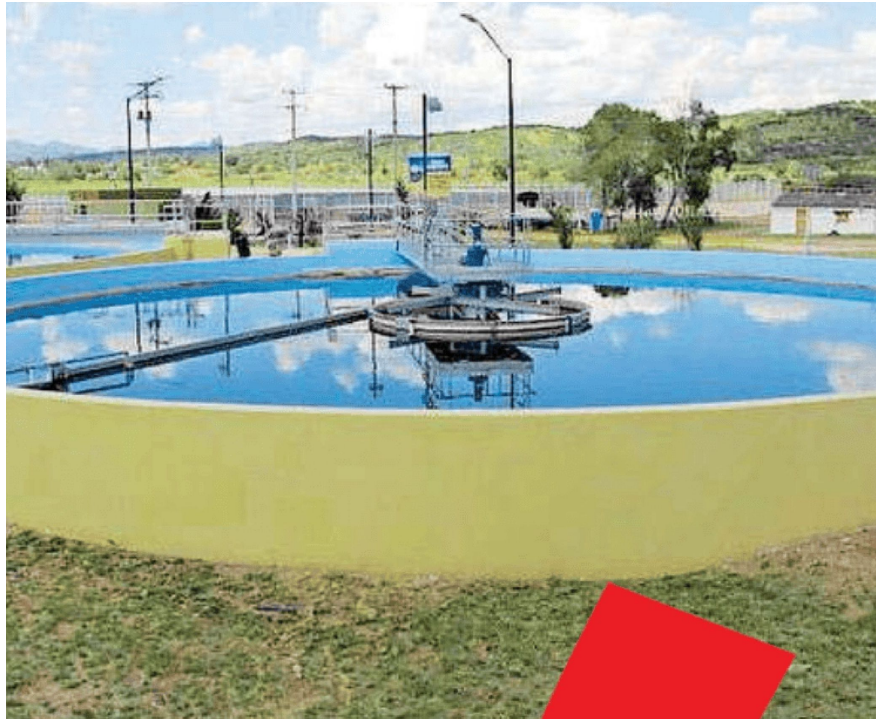
Planta de tratamiento en Sonora

“El envejecimiento de infraestructura de aguas pluviales (...) afectan la salud pública y el medio ambiente en Arizona y California”