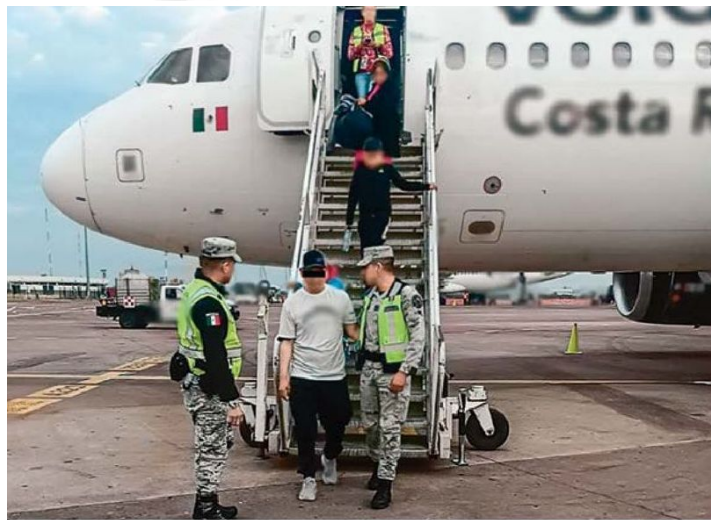
ARRESTO. Al llegar al Aeropuerto Internacional de Guadalajara, Jalisco, personal de la Guardia Nacional realizó la detención de Mario N.