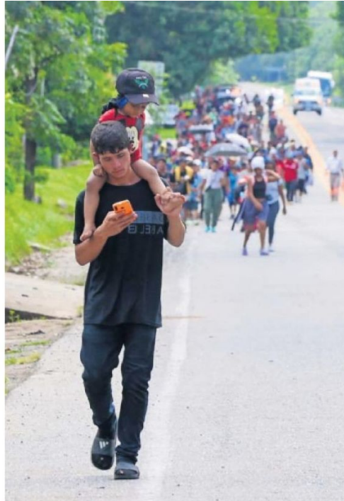
Unas 300 personas de diversas nacionalidades caminan sobre la carretera costera de Chiapas.

“Con las restricciones en la política migratoria, quien más pierde son las personas en movilidad... A quien más beneficia es a una economía criminal”