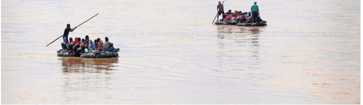
Las personas migrantes pagan a traficantes en Guatemala para que las crucen en balsas a través del río Suchiate.