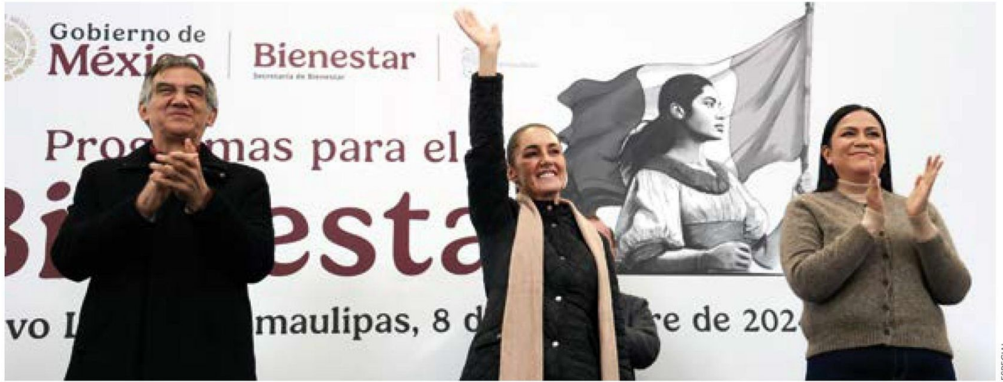
Gira. El gobernador de Tamaulipas, Américo Villarreal, la presidenta Claudia Sheinbaum y la secretaria de Bienestar, Ariadna Montiel, ayer.