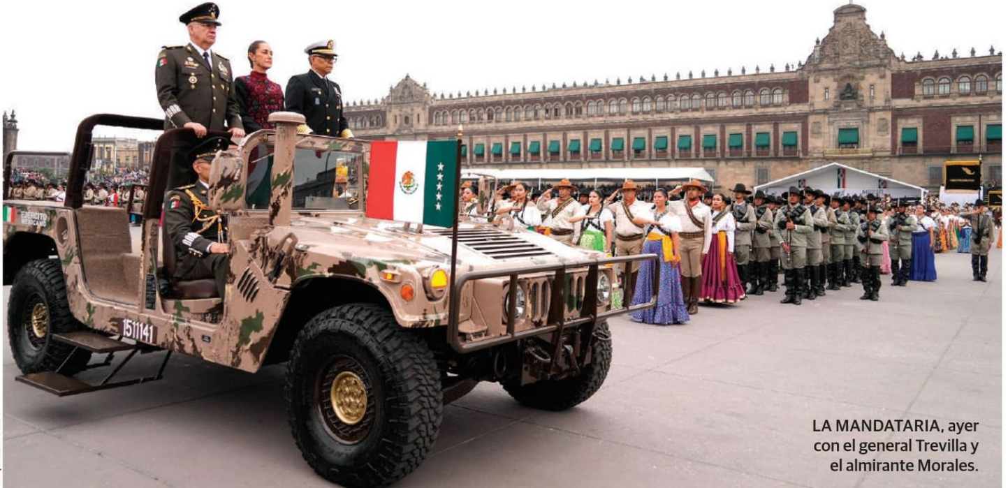
LA MANDATARIA, ayer con el general Trevilla y el almirante Morales.

SHEINBAUM destaca en el 114 aniversario del inicio de la Revolución las transformaciones; asegura que México es visto con admiración en el mundo; destaca apoyo de Fuerzas Armadas en seguridad y obras; éstas refrendan lealtad a la Presidenta y a la nación; cientos de familias aplauden a contingentes. pág. 12