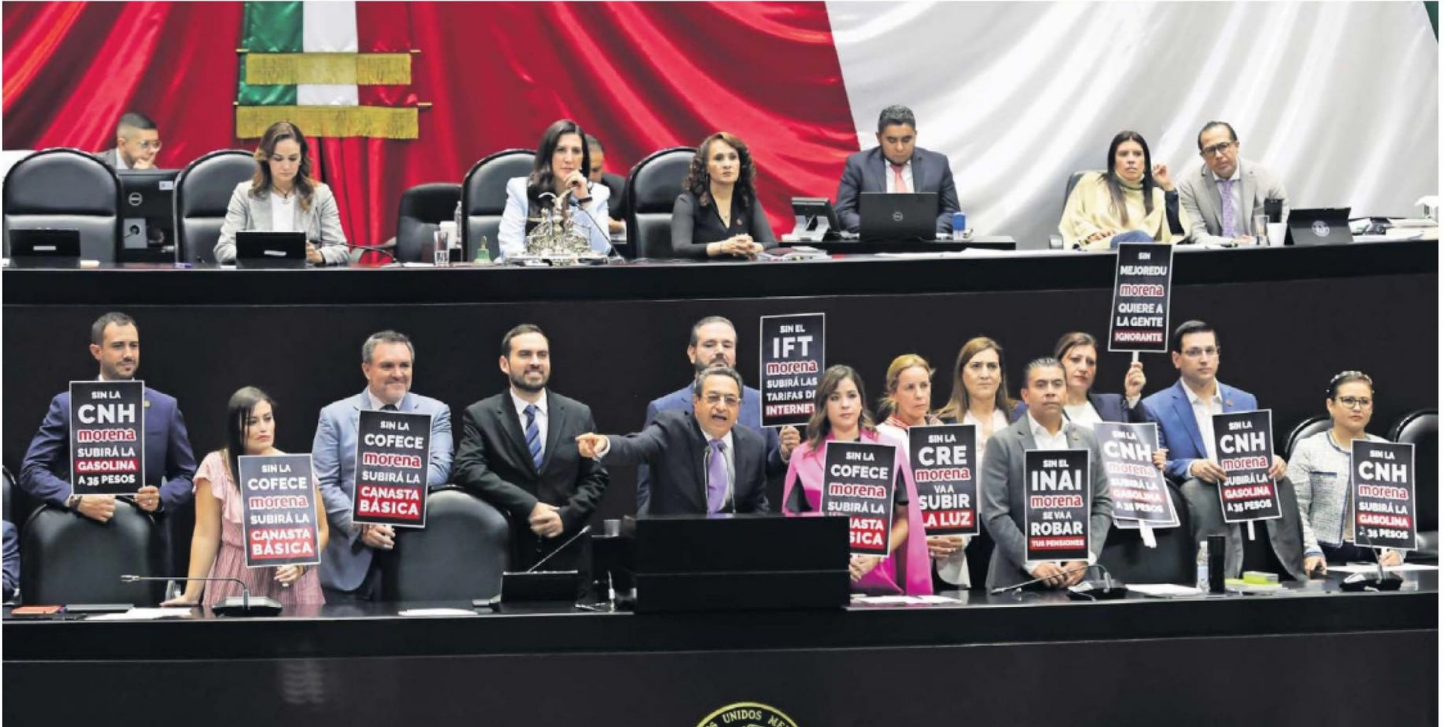
Los diputados de oposición señalaron que la reforma constitucional afectará la transparencia y la evaluación de las políticas públicas del gobierno federal.