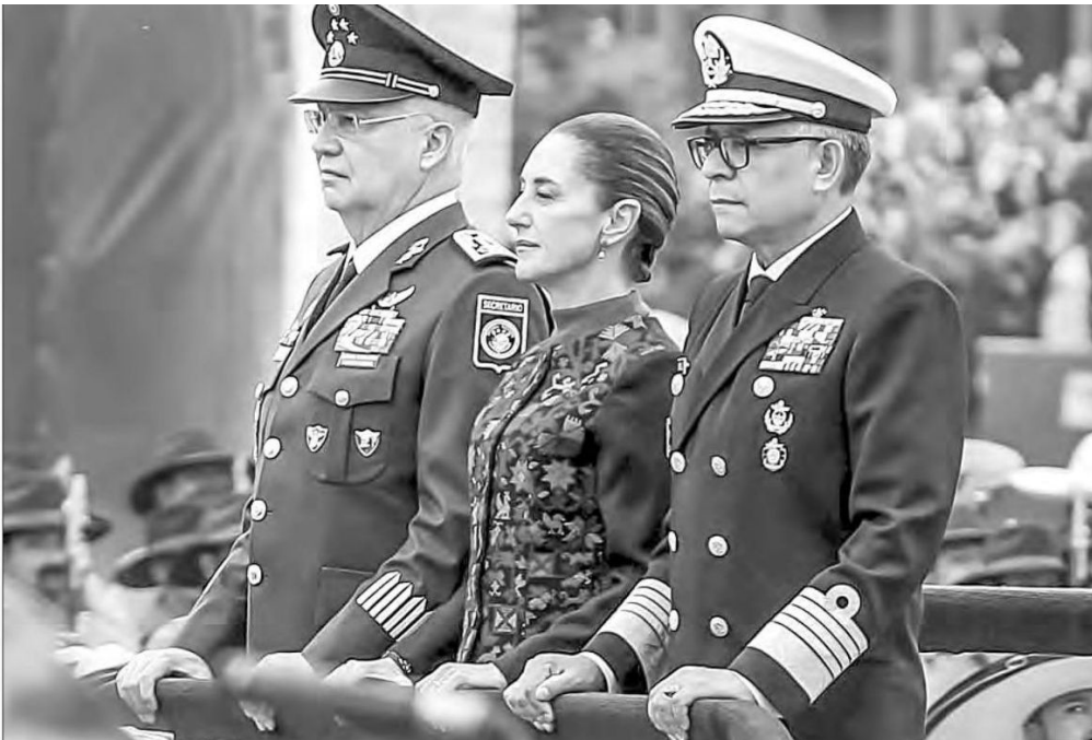
▲ Flanqueada por los titulares de la Defensa y la Marina, la mandataria presenció la parada militar.

“Tengo claro que sólo con el apoyo de la amplia mayoría del pueblo se puede seguir llevando a cabo esta gran transformación de nuestra patria. Por eso, nunca nos separaremos de los sentimientos de la nación, nunca nos separaremos del pueblo de México”, enfatizó.