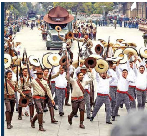
EMPUÑAN SUS ARMAS. Con vestimenta propia de la época y con actitud gallarda, evocaron el inicio de la Revolución.