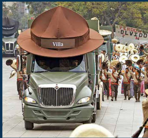
VILLA SE HACE PRESENTE. Con un sombrero en referencia a Francisco Villa, este tráiler lideró a un contingente.