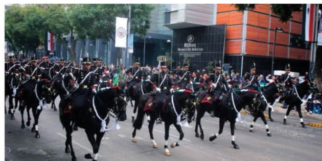
ELEMENTOS de las Fuerzas Armadas montados a caballo durante el desfile cívico, ayer.