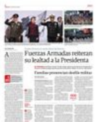
LA PRESIDENTA de México, Claudia Sheinbaum Pardo, flanqueada por el secretario de la Defensa Nacional, Ricardo Trevilla Trejo (izq.) y el titular de la Marina, Raymundo Pedro Morales Ángeles (der.), ayer, al presidir el desfile militar.