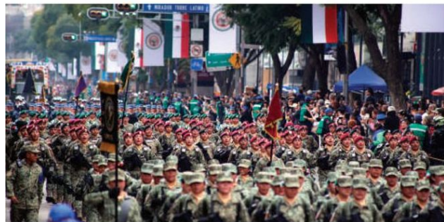
MUJERES del Ejército Mexicano participaron, ayer, en el 114 Aniversario de la Revolución Mexicana.

RICARDO TREVILLA TREJO Titular de la Semar