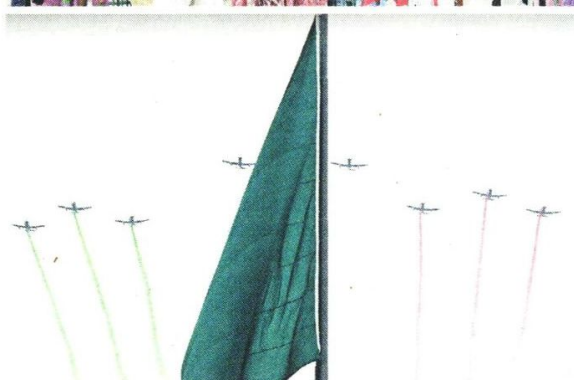
■ En el desfile participaron 2 mil 576 militares, algunos de los cuales escenificaron pasajes importantes de la Revolución.