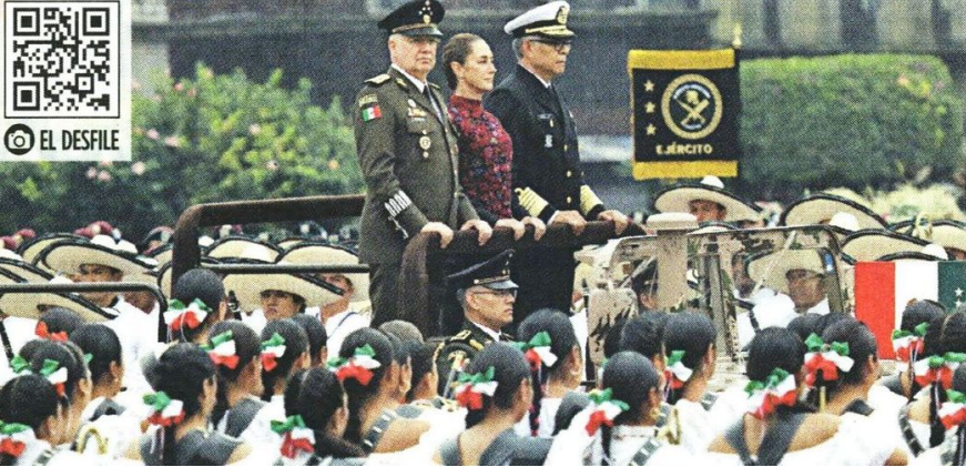
La Mandataria realizó el pase de revista a las tropas acompañada del Secretario de Defensa, Rafael Trevilla, y del Secretario de Marina, Raymundo Pedro Morales.