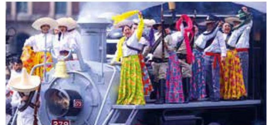
Acto. Ayer se llevó a cabo el desfile conmemorativo del Día de la Revolución Mexicana en el Zócalo de la Ciudad de México.