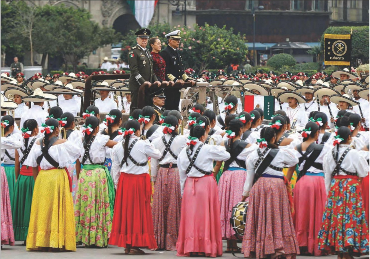
▲ Durante la conmemoración en el Zócalo del 114 aniversario del inicio de la Revolución Mexicana, la presidenta Sheinbaum sostuvo que con la 4T se está “recuperando el sentido social de la Constitución” y enumeró los múltiples cambios efectuados desde 2018, entre ellos el reconocimiento a los plenos derechos de las mujeres. A su vez, el titular de la Defensa, Ricardo Trevilla, destacó que hoy ellas ocupan puestos de gran relevancia en la vida pública. Foto Germán Canseco I. SALDAÑA YA. URRUTIA/P9