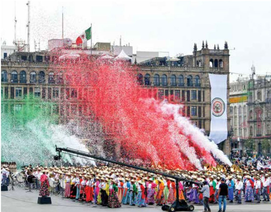
● COLOR. En el desfile, dedicado a las mujeres, participaron las famosas Adelitas.