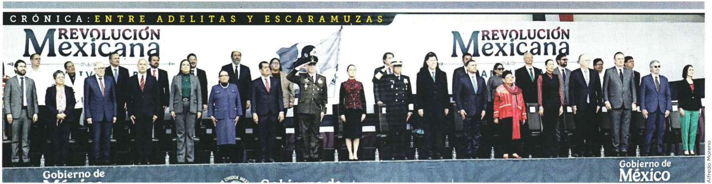
■ Acompañada de los integrantes de su Gabinete, la Presidenta Claudia Sheinbaum encabezó ayer en el Zócalo la ceremonia por el 114 Aniversario de la Revolución Mexicana.