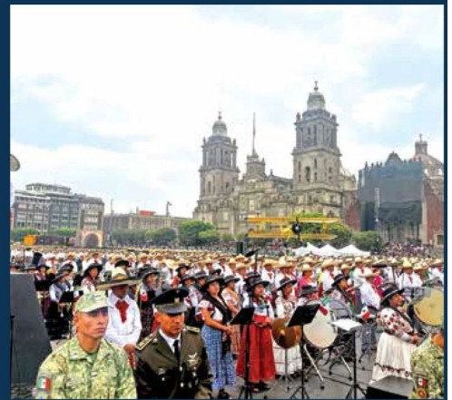
AL SON DE LA HISTORIA. Piezas musicales, clásicas del movimiento revolucionario, hicieron eco en el Zócalo capitalino.