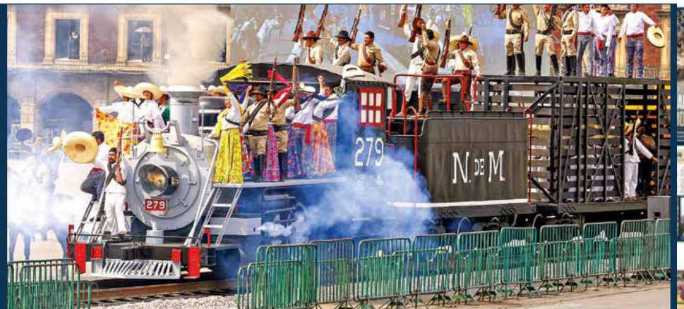
LLENO COLOR. En la ceremonia conmemorativa también participaron 112 charros, 297 niñas y niños, tres águilas y una locomotora. Hubo algunas incidencias con diez caballos que sufrieron caídas o resbalaron. Además, una adelita resultó lesionada.