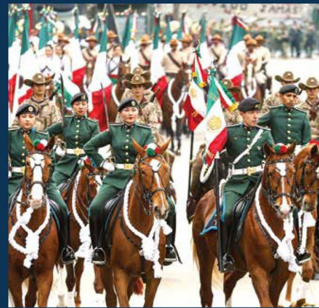
A PASO FIRME. A bordo de caballos, integrantes de las Fuerzas Armadas se movilizaron en el Zócalo capitalino.