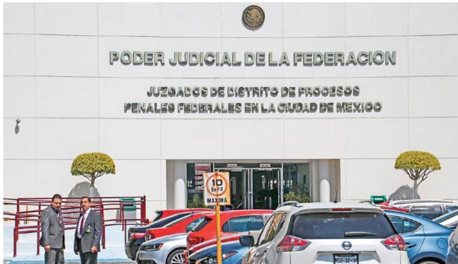
CRISIS. De acuerdo a la Corte, el Plan C afectará a todo tipo de juicios que actualmente se encuentren en curso en todo el país.

El estudio concluye que “de un día para otro habrá nuevos juzgadores penales a cargo de procesos penales orales ya iniciados; las nuevas personas juzgadoras deberán conducir audiencias orales, sin experiencia previa, e interactuar con fiscales y abogados y abogadas defensoras expertos, en casos que no conocerán a profundidad. Esto se replicará posteriormente en los poderes judiciales locales de las entidades federativas”.