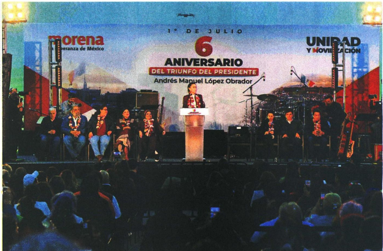
La virtual presidenta electa de México, Claudia Sheinbaum Pardo, celebró el sexto aniversario del triunfo de Andrés Manuel López Obrador como primer mandatario del país, y aseveró que en su gestión no habrá retornos al pasado.