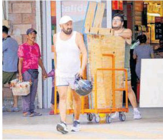
Habitantes compran tablas para proteger ventanas