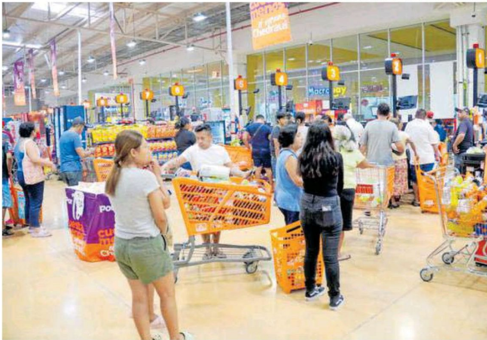
Supermercados en Cancún registraron más afluencia de personas