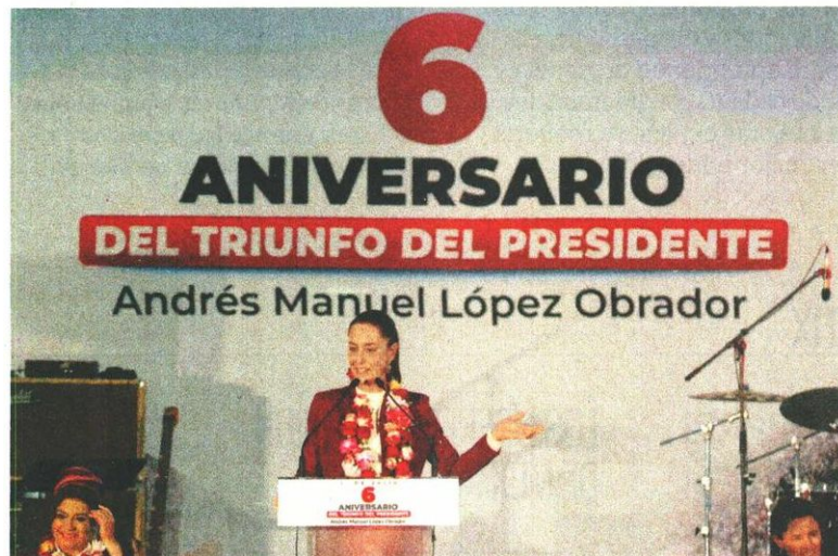
Claudia Sheinbaum destacó el legado de López Obrador en el sexenio.