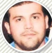
● JOAQUÍN GUZMÁN LÓPEZ Se entrega el 25 de julio de 2024. DETENIDO