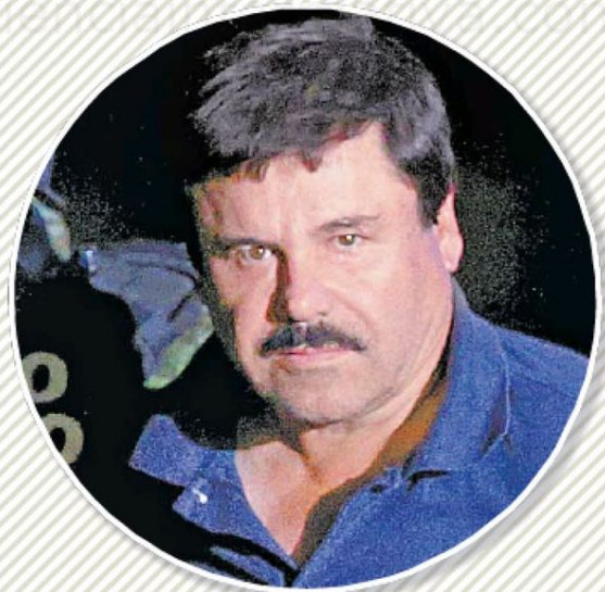
● JOAQUÍN GUZMÁN LOERA Aprehendido en enero de 2016. DETENIDO Recluido en la prisión de máxima seguridad ADX Florence en Colorado, Estados Unidos.