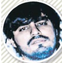
● DÁMASO LÓPEZ SERRANO, EL MINI LIC Se entrega en EU el 27 de julio de 2017. En libertad condicional