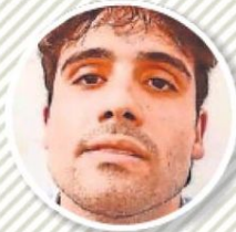
● OVIDIO GUZMÁN LÓPEZ Capturado el 5 de enero de 2023. DETENIDO Recluido en el Centro Correc- cional Metropolitano de Chicago.