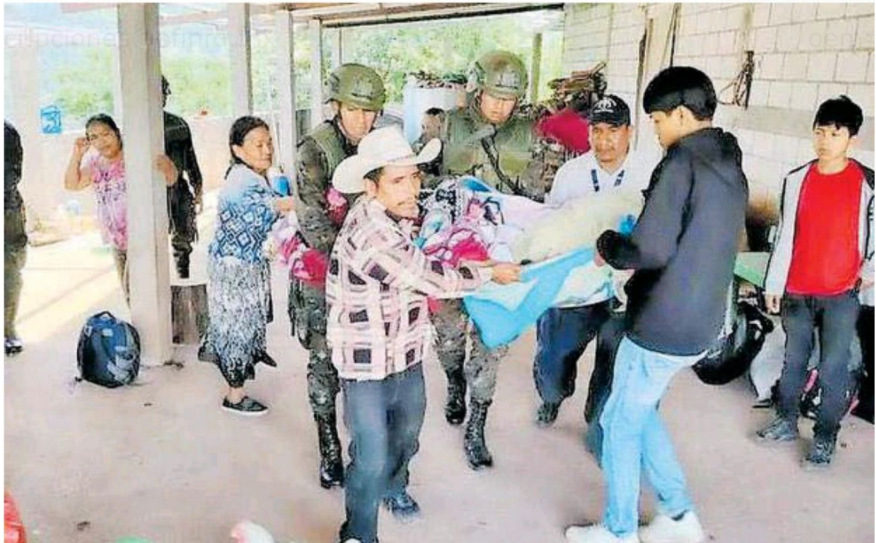
Habitantes de Chiapas son recibidos en albergues comunitarios de Cuilco, Guatemala