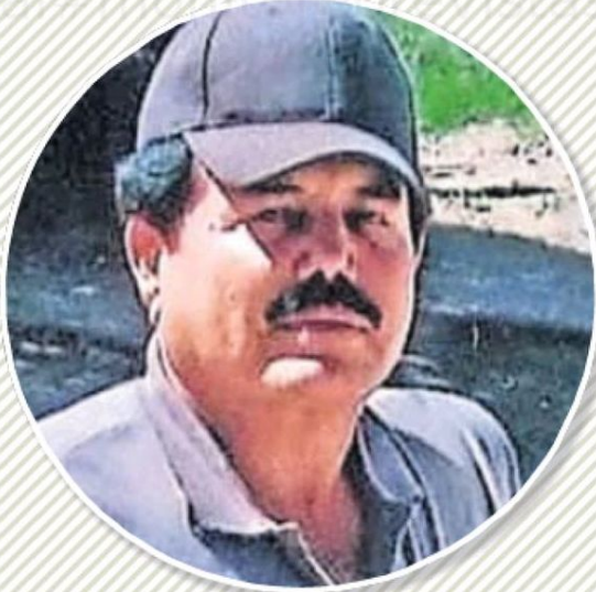
● ISMAEL EL MAYO ZAMBADA Se entrega el 25 de julio de 2024. DETENIDO