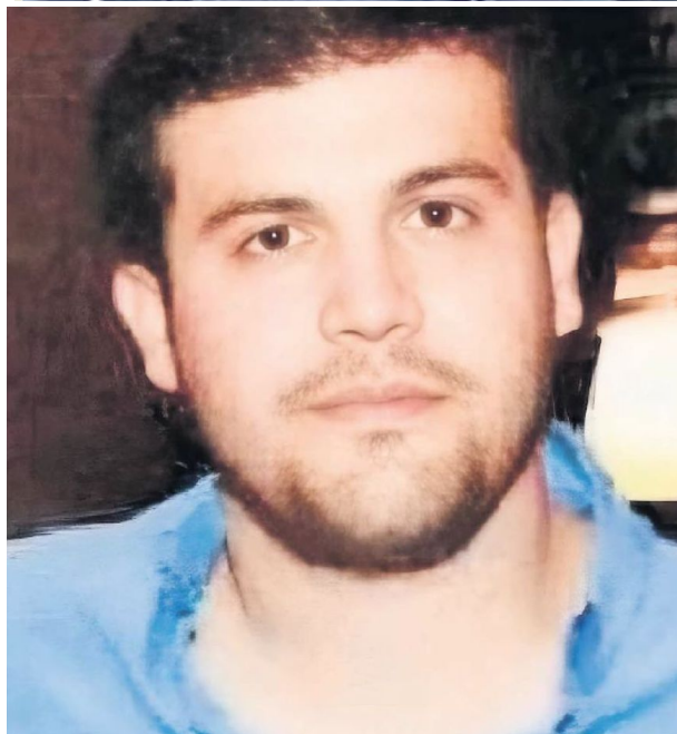
Ismael Mario Zambada y Joaquín Guzmán López enfrentan diversos cargos por dirigir operaciones del Cártel de Sinaloa , como el tráfico de fentanilo.