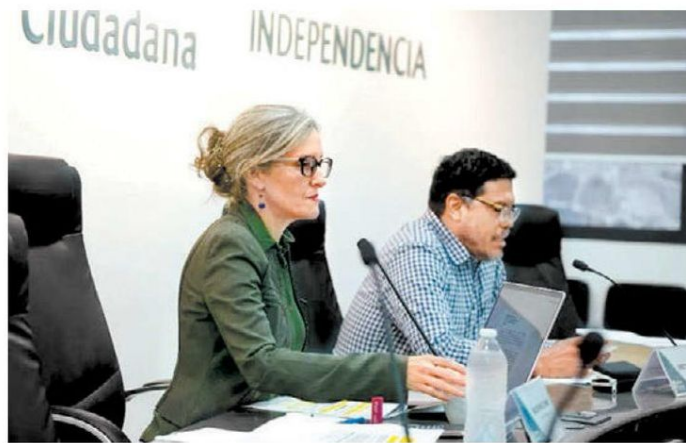
Sesión del consejo de Jalisco.

procedencia sobre el nuevo escrutinio y cómputo en sede jurisdiccional, así como una deficiente justificación de vincular al Instituto Electoral y de Participación Ciudadana del estado para el desarrollo y vigilancia del recuento, este órgano concluyó revocar la determinación combatida para los efectos precisados en la sentencia”.