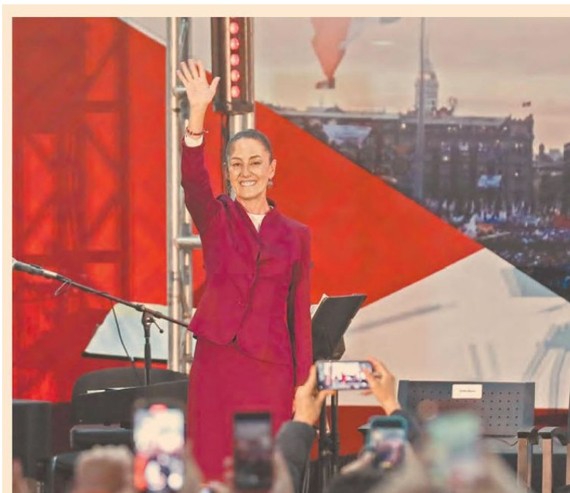
La futura mandataria, Claudia Sheinbaum Pardo, detalla sus compromisos en 100 pasos para la Transformación .