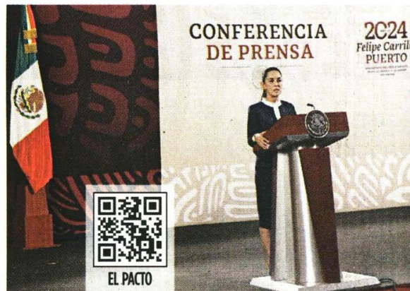
■ Claudia Sheinbaum en conferencia de prensa en el Salón Tesorería, tras su reunión con López Obrador.