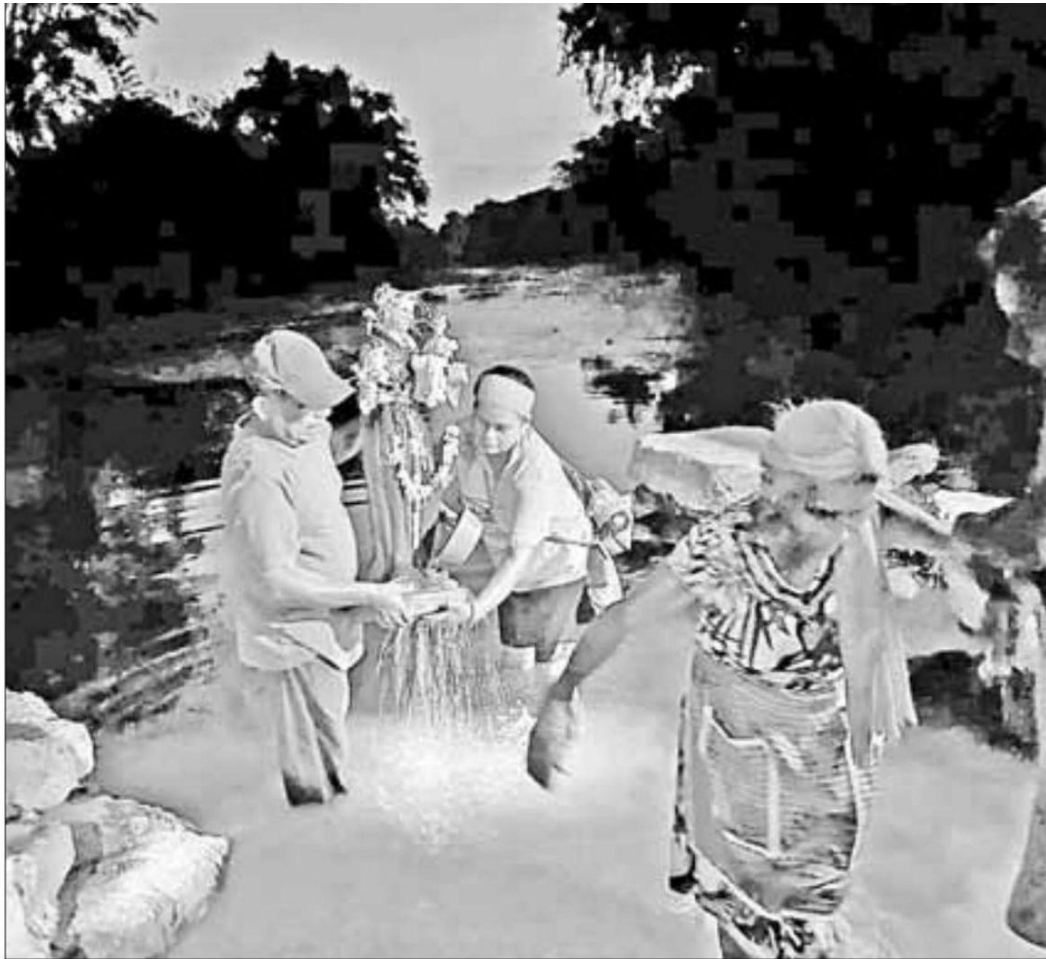
▲ Habitantes del municipio de Tantoyuca, Veracruz, realizan un ritual a orillas del río Calabozo, para pedir a San Antonio de Padua enviar lluvias y evitar que el cauce se seque en su totalidad.