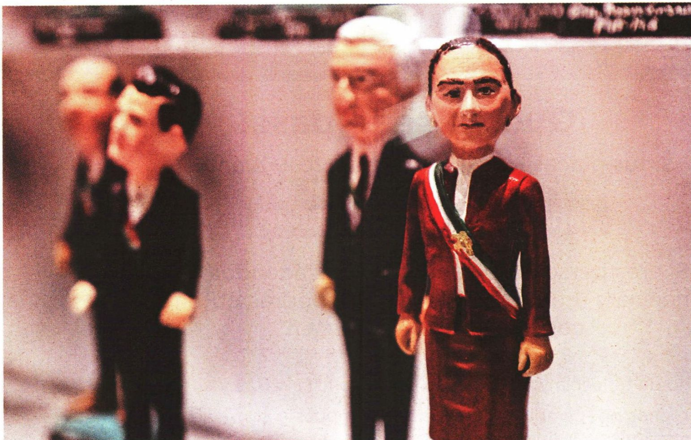
Figura en miniatura de la mandataria que se expone en el Museo de Historia Mexicana en Nuevo León.

No obstante, descartó una orden de aprehensión contra la Presidenta, pues “el Ministerio Público tendría que desaforarla y, tomando en consideración que son mayoría en el Congreso, no creo que se llegara a dar. —