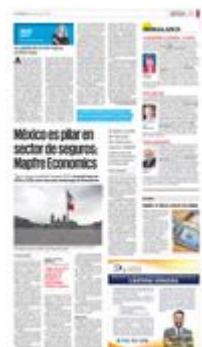
Juan José Padilla