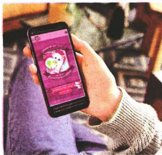
La participación de los chilangos fue copiosa.

En el caso de la votación presencial, se contemplan las 3 mil 135 personas de la Ciudad de México que manifestaron de manera previa su interés de votar por esta vía, así como un máximo de 34 mil 500 personas de todo el país sin registro previo que corresponden a mil 500 por cada una de las 23 sedes consulares, que pudieron llegar el domingo 2 de junio a emitir su voto con su credencial para votar vigente.