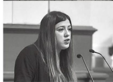
Podría perder la diputación