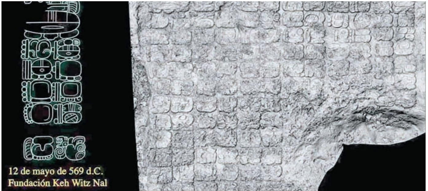
▼ Panel con 123 cartuchos jeroglíficos descubierto en Cobá, zona arqueológica ubicada en Quintana Roo.