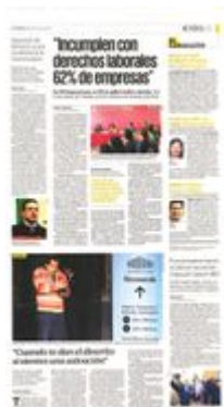
Clientes dijeron que el Monte de Piedad otorga un plazo de pago de tres a cinco meses para recuperar la prenda, pero al quinto mes se puede renovar.