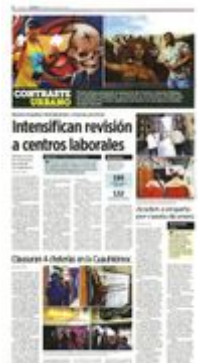
Capitalinos acuden a casas de empeño para cubrir los gastos generados durante las fiestas decembrinas.