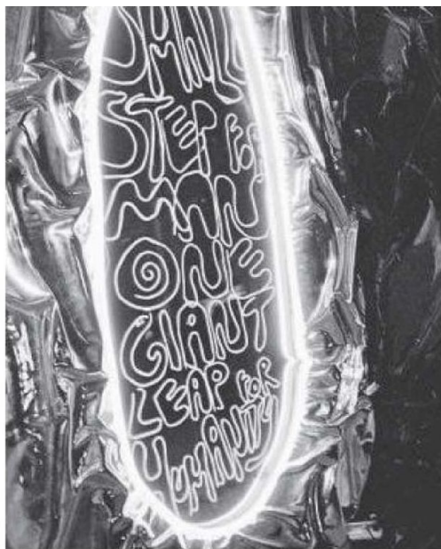
Esta es la primera exposición de arte que se realiza fuera de la Tierra