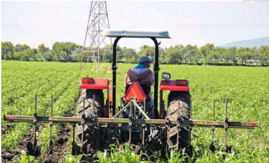
Dan atención prioritaria a productores de maíz en el estado